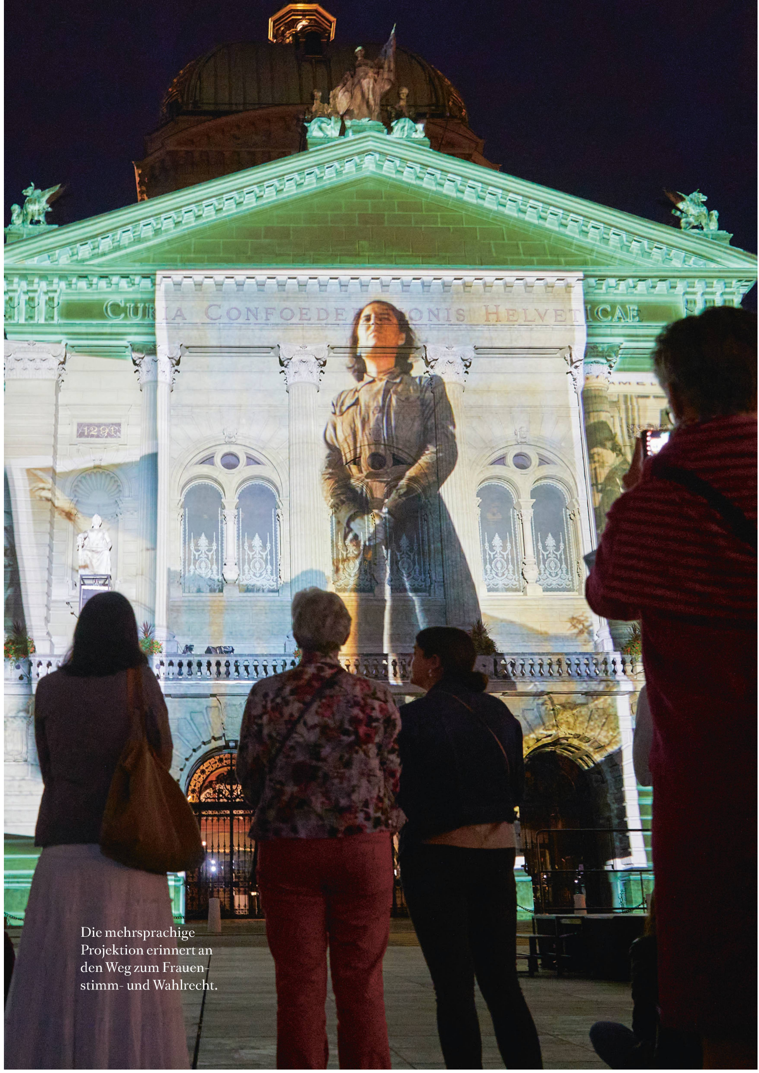
Die mehrsprachige Projektion erinnert an den Weg zum Frauen- stimm- und Wahlrecht.