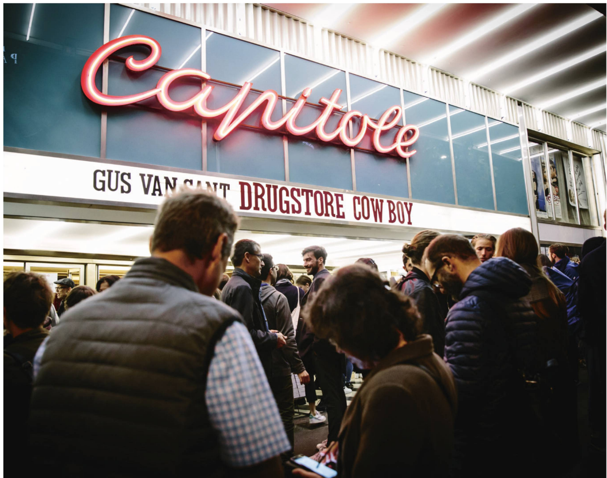
Ab 2024 wird das restaurierte Kino Capitole teil der Cinémathèque suisse.

aus, um die Flut an Spenden und Hinterlegungen zu bewältigen und ein neues Gebäude wurde erdacht, gebaut und schliesslich 2019 eingeweiht.