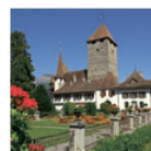
Le Château de Spiez Art et histoire

Le fumoir oriental, construit en 1855 tout en haut dans le donjon, dégage une ambiance unique. Thème de l'exposition spéciale 2016 : «Schlossräume & Schlossräume – rêves et espaces de château».