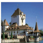
Le Château de Oberhofen Magie de huit siècles

Le Château de Thoune offre une vue imprenable sur lac, la ville et les montagnes. Les expositions historiques culturelles présentées sur plusieurs étages du donjon vieux de 800 ans font revivre