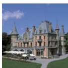
Le Château de Schadau Perle au bord du Lac

le riche passé de la région. Thème de l'exposition spéciale 2016 : «Traces du passé – un voyage dans le temps à l'intérieur du Château de Thoune».