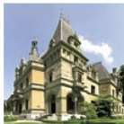
Le Château de Hünegg Palais de conte de fées au bord du Lac

Le Château de Hünegg à Hilterfingen est situé dans un magnifique parc avec vue sur les alpes. On peut y admirer ses intérieurs du style „art nouveau” datant de 1900, dont les décors sont restés inchangés depuis. Thème de l'exposition spéciale 2016 : «Delightful Horror» – la sublimité des Alpes et les débuts du tourisme.