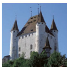
Le Château de Thoune Le château-musée

Le Château de Spiez et sa chapelle romantique sont situés sur une petite presqu'île entourée du Lac de Thoune et de montagnes. La nouvelle exposition permanente donne un aperçu de 1300 ans d'histoire. Thème de l'exposition spéciale 2016 : «Ernst Ludwig Kirchner – Berlin - Davos».