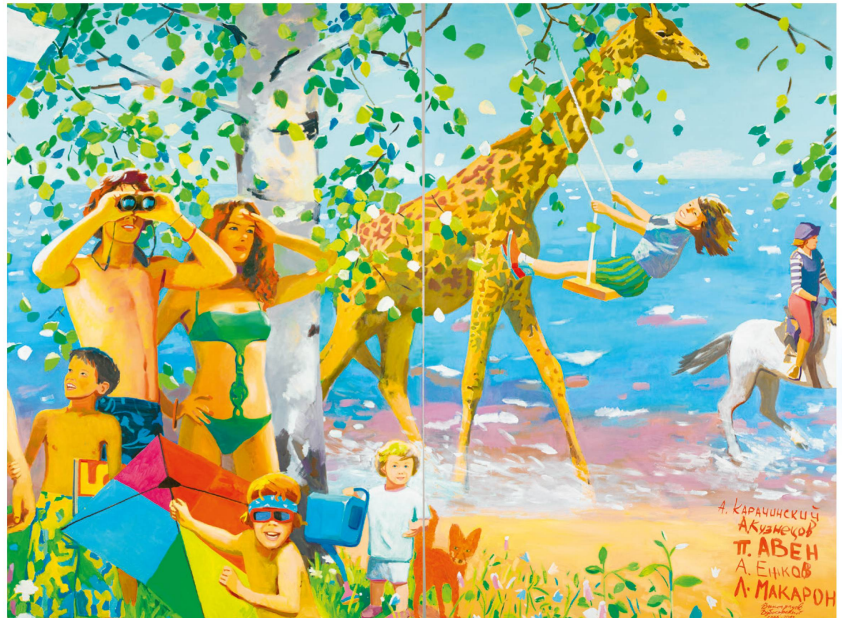
Vladimir Dubossarsky/Alexander Vinogradov: What the Homeland Begins With , 2006, Huile sur toile, 295 × 780 cm © the artists