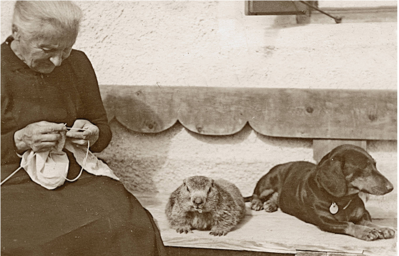
Les marmottes faisaient autrefois partie des animaux domestiques comme le montre cette photo de 1925 prise à S-charl.

mes cousines d'Hérens en connaissent un rayon, et lorsqu'elles choisissent leur reine, les hommes accourent de loin pour assister au sacre.»