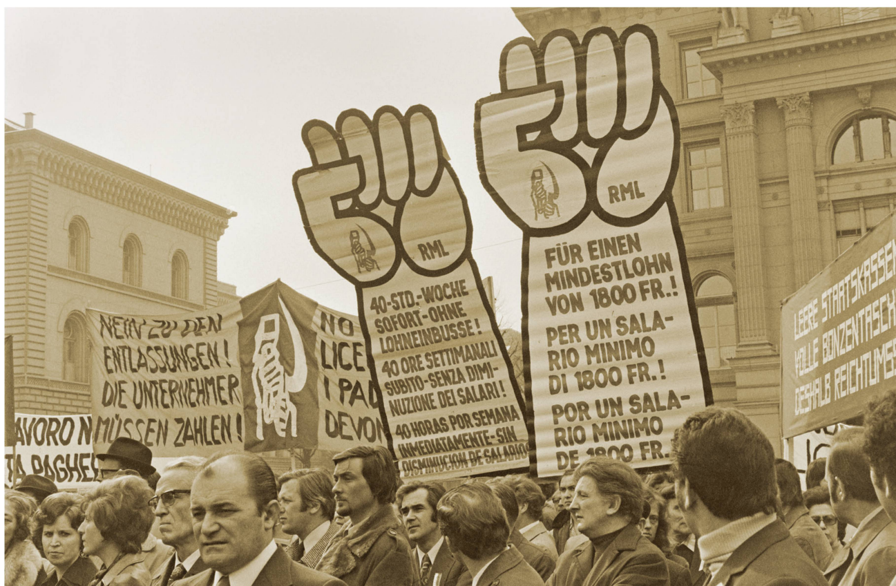
Démonstration de cordonniers sur la Place fédérale, à Berne, vers 1975.

sa récente dématérialisation. Les clichés témoignent aussi des professions exercées par les femmes au fil du temps, avec leur accession dans les années 70 à des métiers réservés jusqu'alors aux hommes, des tensions entre plein emploi et chômage et de la dissolution