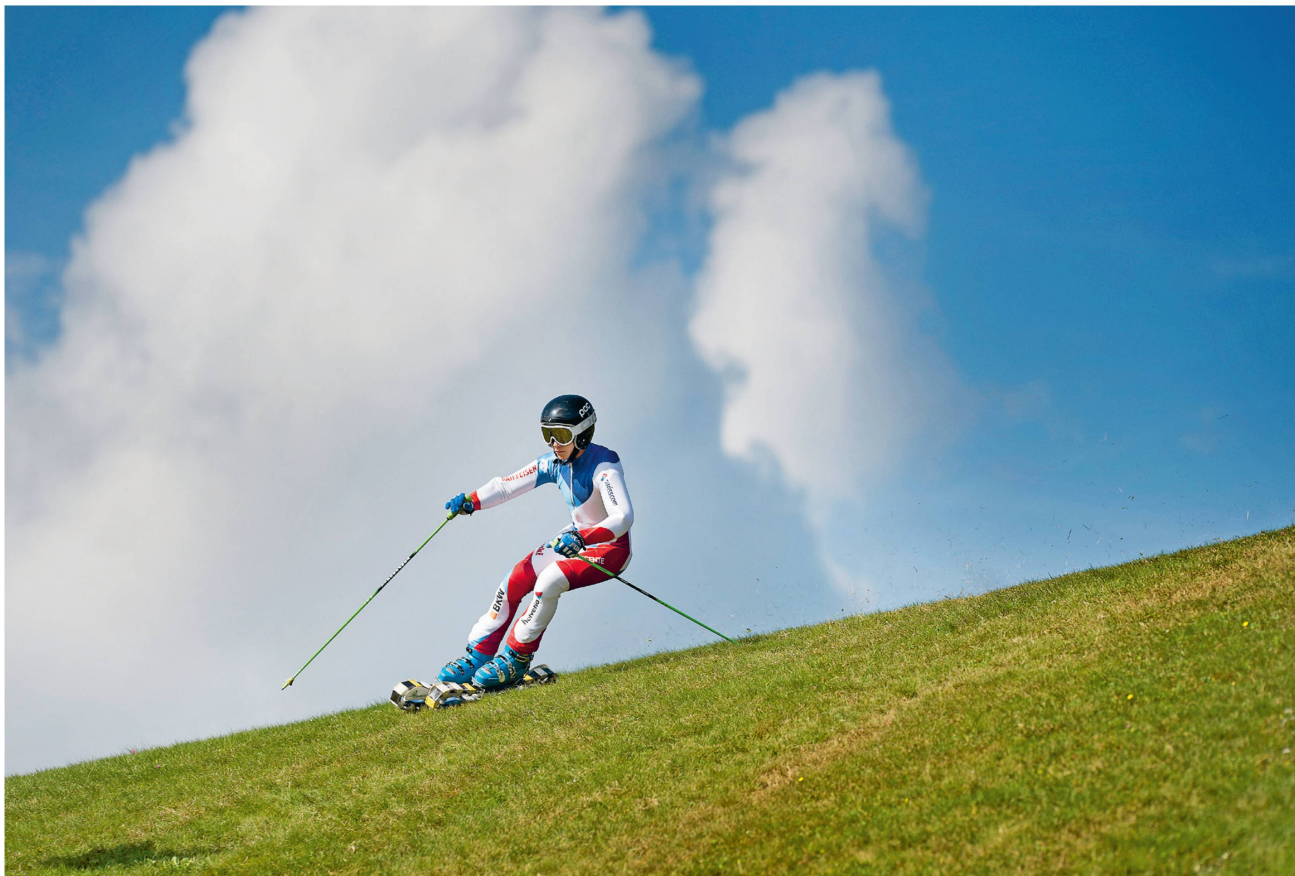
Karin Hofer, photographe, a couvert le championnat suisse de ski sur herbe qui s'est disputé à Marbach (Entlebuch). Les concurrents dévalaient la pente équipés de roulettes à chenilles.