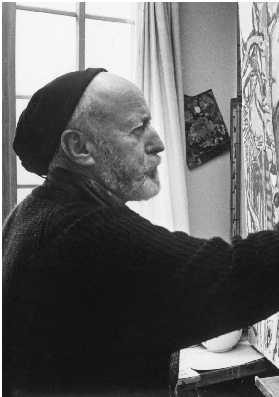
Alois Carigiet (1902-1985) possédait de multiples talents : illustrateur de livres pour enfants restés fameux, mais aussi graphiste et peintre.

forge rapidement une réputation de graphiste talentueux et crée des affiches destinées aux mondes de la mode et du tourisme ainsi qu'à des organisations politiques. Son style très personnel allié à un soupçon d'humour fait de ses affiches des œuvres uniques et les commandes s'accumulent. Indépendant depuis 1927, Alois Carigiet doit recruter des employés pour pou-