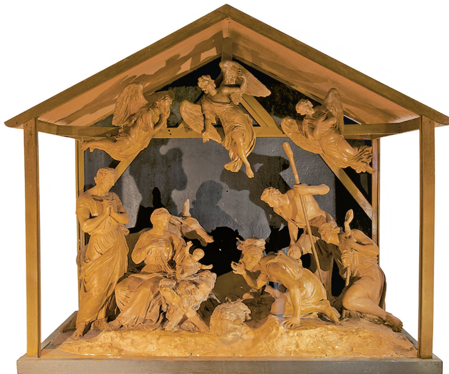
Crèche en terre cuite réalisée par le sculpteur d'Einsiedeln Ildefonso Curiger, vers 1820.