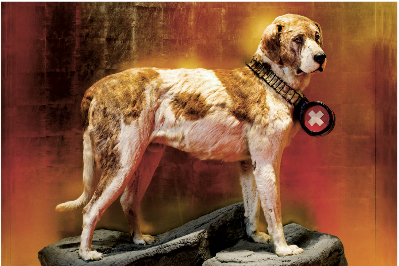
Remodelé en 1923, Barry a une apparence très différente: ses pattes sont plus longues, les endroits dépourvus de poils ne sont plus situés vers les coudes et la tête ressemble désormais aux saint-bernard actuels.