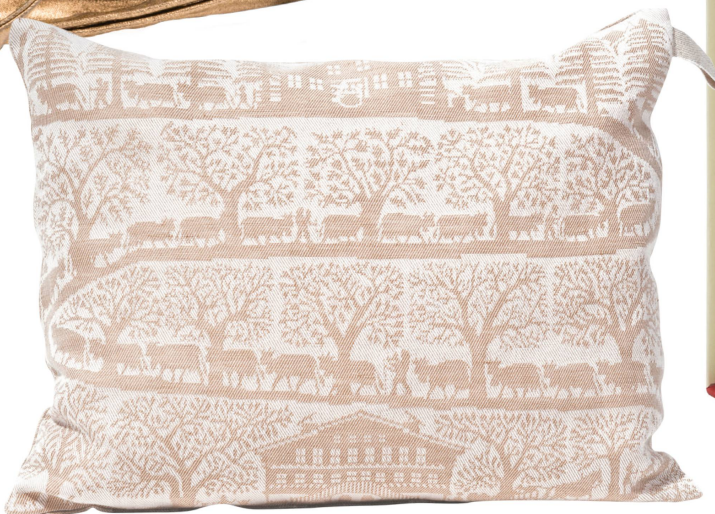
Paysage à l'arolle : Représentant l'Inalpe Poche en toile métis Jacquard / CHF 76