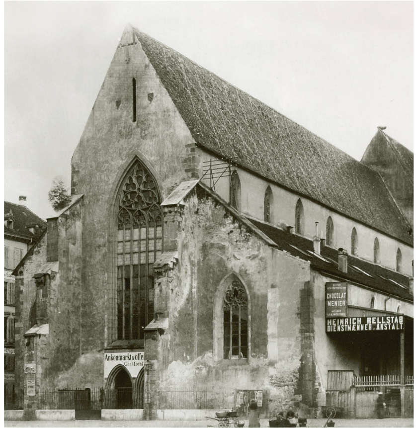
Vers 1890, la Barfüsserkirche servait de marché au beurre («Ankenmarkt»).