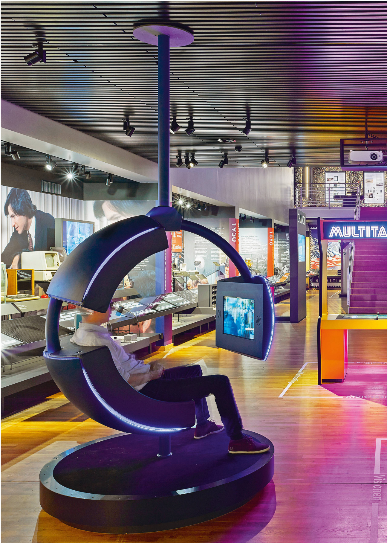
De la lettre à Internet en passant par la télévision : l'exposition éclaire l'évolution des moyens de communication.