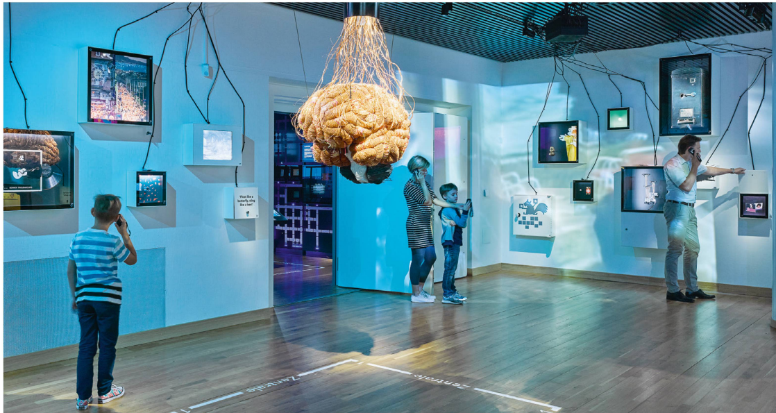
Aussi une sorte de big data : le musée éclaire aussi le thème de la communication.