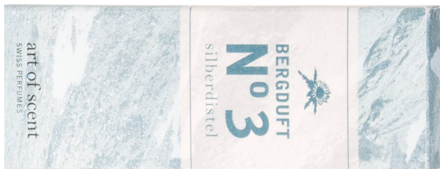
Parfum : Bergduft N°3 Silberdistel art of scent, 50 ml / CHF 79