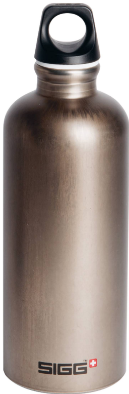
Gourde: Traveller Smoked Pearl Sigg, 0,6l/CHF 24.90