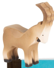
Figurine en bois : Bouquetin Trauffer / CHF 19.50