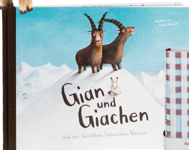
Livre : Gian und Giachen J. v. Matt, Amélie Jackowski, éditions NordSüd 2016 / CHF 25