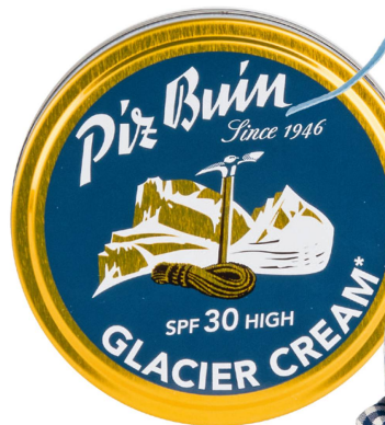
Crème : crème des glaciers Piz Buin, 40 ml / CHF 12