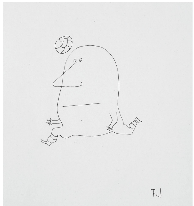
Friedrich Dürrenmatt, [joueur de football IV], s.d., stylo à bille sur papier, 29,5×20,8 cm, collection du Centre Dürrenmatt Neuchâtel.