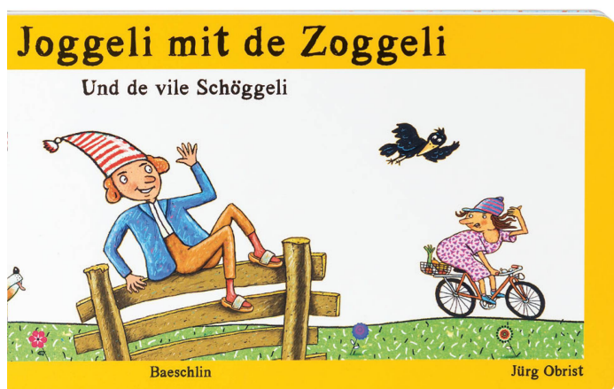
Livre : Vom Joggeli mit de Zoggeli Dan Wiener, Jürg Obrist, éditions Baeschlin, 2018 / CHF 26.90