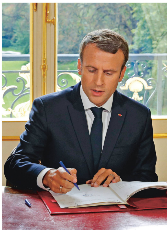
Emmanuel Macron, ici dans son office, a rendu hommage à l'exposition sur les indiennes au Château de Prangins.

22 AVRIL – 14 OCT 18 CHÂTEAU DE PRANGINS Indiennes. Un tissu révolutionne le monde !