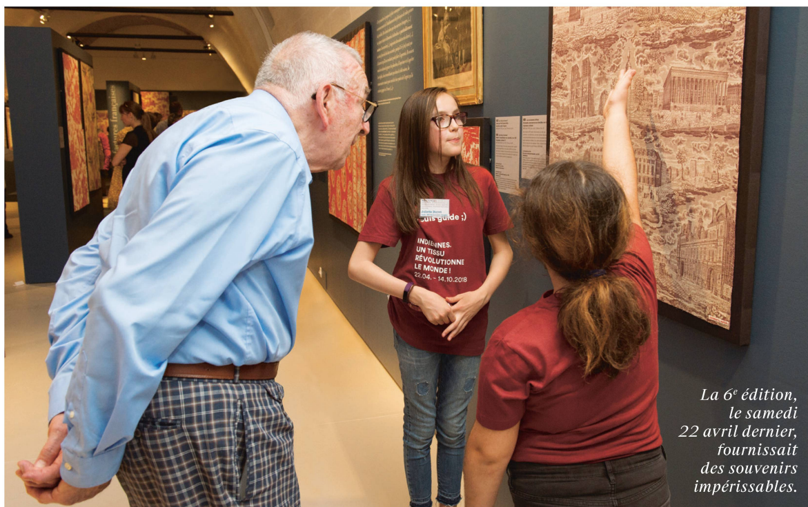
La 6 e édition, le samedi 22 avril dernier, fournissait des souvenirs impérissables.

U ne époque commentée avec les yeux de demain», voilà un témoignage laissé dans le livre d'or du musée qui résume parfaitement cette action menée depuis 2013 au Château de Prangins. Mais qu'en est-il exactement ?