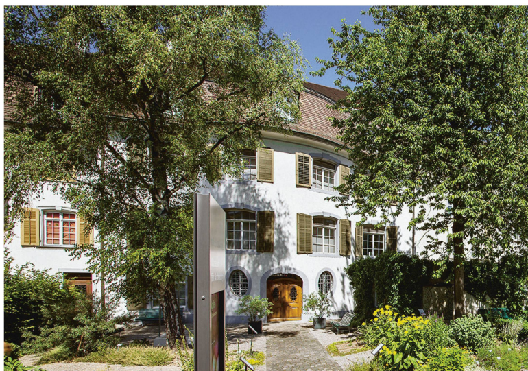
Le musée est abrité dans les locaux de la Luzernerhaus, bâtie en 1771.

Que l'on choisisse la visite avec les commentaires de Darwin, celle avec les énigmes musicales du compositeur Marcel Haag ou que l'on renonce à l'audio-guide, on s'arrêtera obligatoirement devant le premier diorama. Car outre les scènes auxquelles on peut s'attendre, qui montrent la vie dans la forêt, dans la campagne et dans les prés, d'autres espaces de vie tels que les villes et les villages sont mis en scène. On se retrouve ainsi face à une poubelle pleine à ras-bord, dont les moineaux picorent les restes de nourriture, ou on regarde à l'intérieur d'un grenier qui n'abrite pas que des chauve-souris. Les visiteurs sont impressionnés par la hutte de castor grandeur nature au deuxième étage et par le tronc d'arbre adroitement travaillé par ce rongeur, qui serait du plus bel effet dans un parc de sculptures.