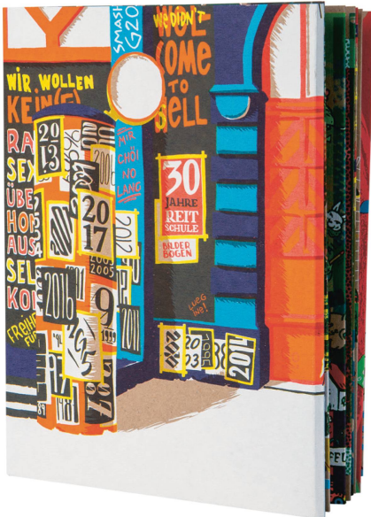
Publication: « 30 Jahre Reitschule Bern » Abteilung Zukunft, reliure en carton, 64 pages / CHF 37.50