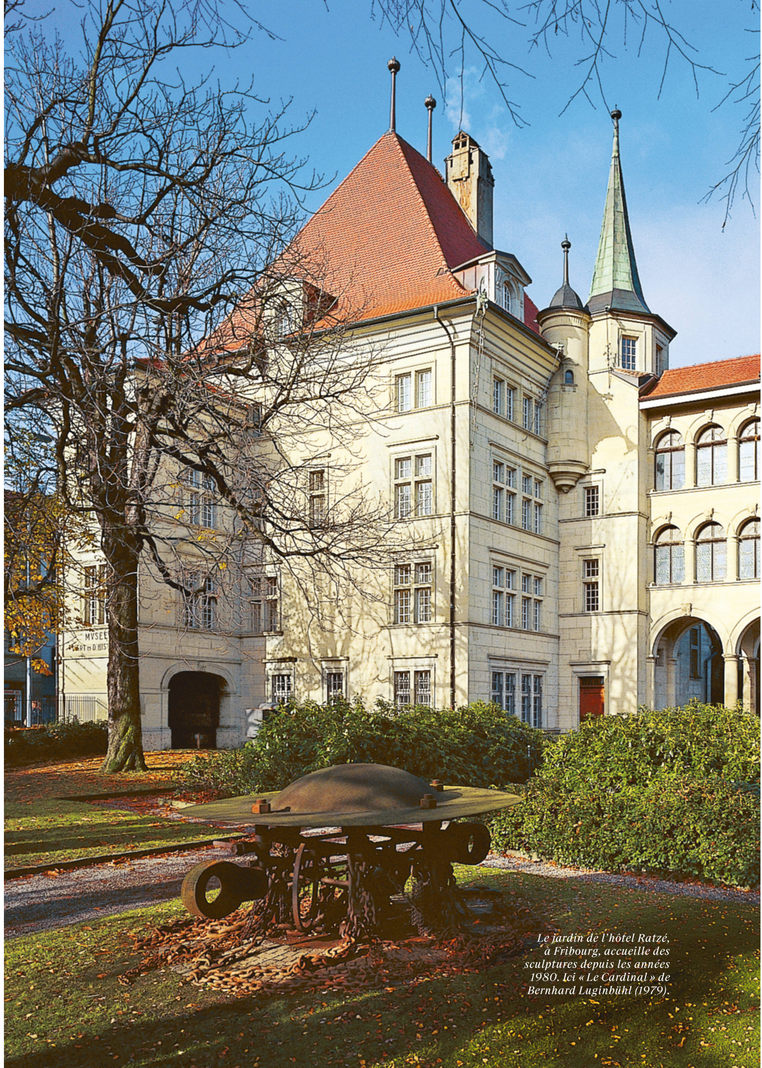
Le jardin de l'hôtel Ratzé, à Fribourg, accueille des sculptures depuis les années 1980. Ici « Le Cardinal » de Bernhard Luginbühl (1979).