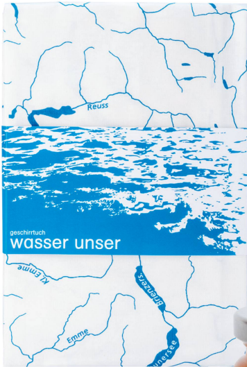
Torchon : nos eaux - « Wasser unser » Musée Alpin Suisse/ CHF 19.90