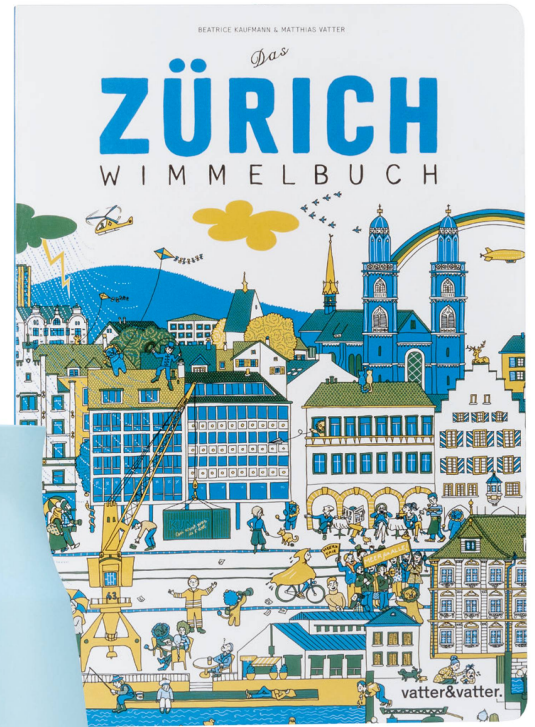
Livre-jeu : « Das Zürich Wimmelbuch » Vatter & Vatter AG, 2015 / CHF 26