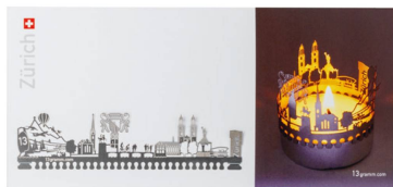
Lanterne : « Zürich T-Light » Lanterne et jeu d'ombres et de lumières, silhouette en acier inoxydable / CHF 8