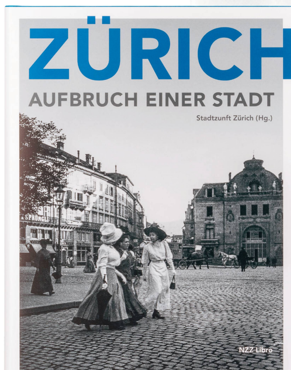
Livre : « Zürich – Aufbruch einer Stadt » NZZ Libro, 240 pages, 2018 / CHF 60