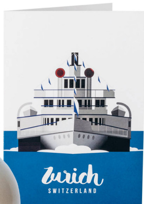
Carte : bateau de Zurich Carte pliée, sujets divers / CHF 6.90