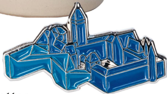
Épinglette : Musée national Zurich Épinglette avec aimant / CHF 9.80