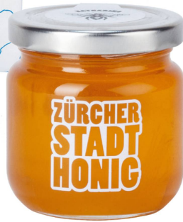
Miel : Miel de la ville Zurich 250 g / CHF 17