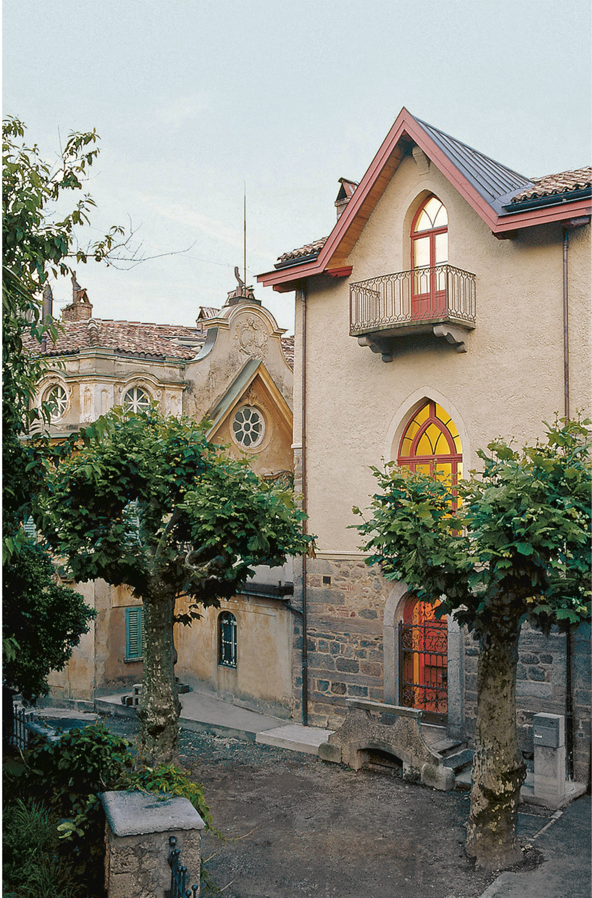
La Torre Camuzzi fait partie de la Casa Camuzzi, villa baroque, et abrite aujourd'hui le Museo Hermann Hesse.