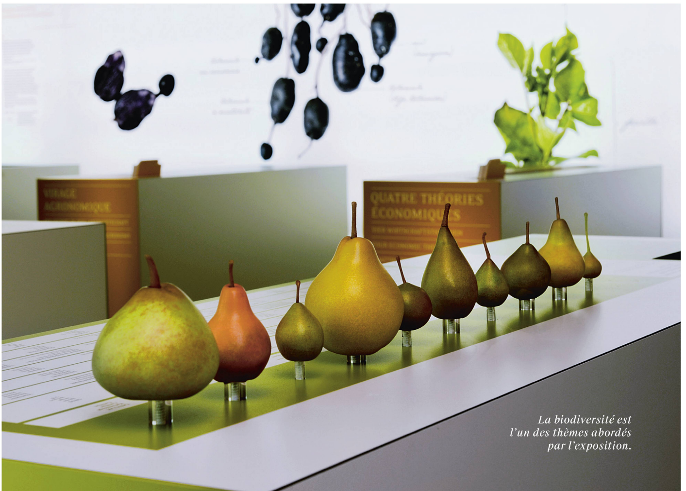
La biodiversité est l'un des thèmes abordés par l'exposition.