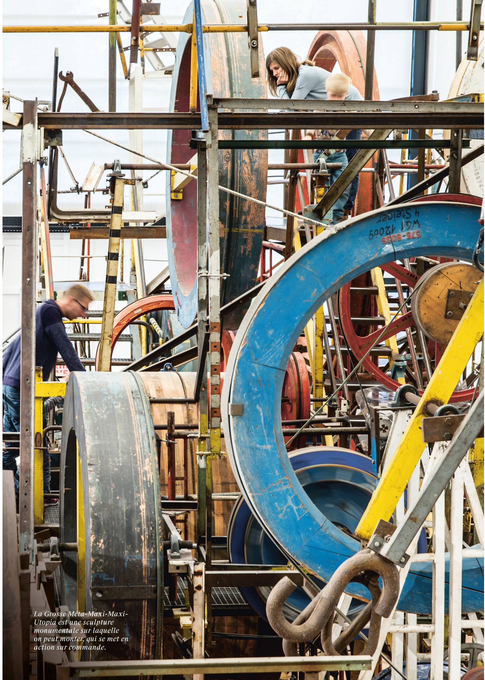
La Grosse Méta-Maxi-Maxi-Utopia est une sculpture monumentale sur laquelle on peut monter, qui se met en action sur commande.