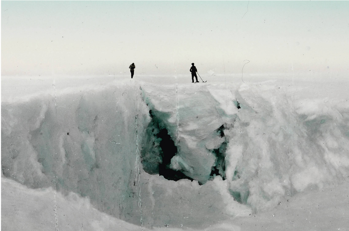
Cette expédition n'était pas sans danger, la glace dissimulant par endroit des crevasses.

en profita grandement. Ce reportage déclencha une véritable « fièvre polaire » en Suisse.