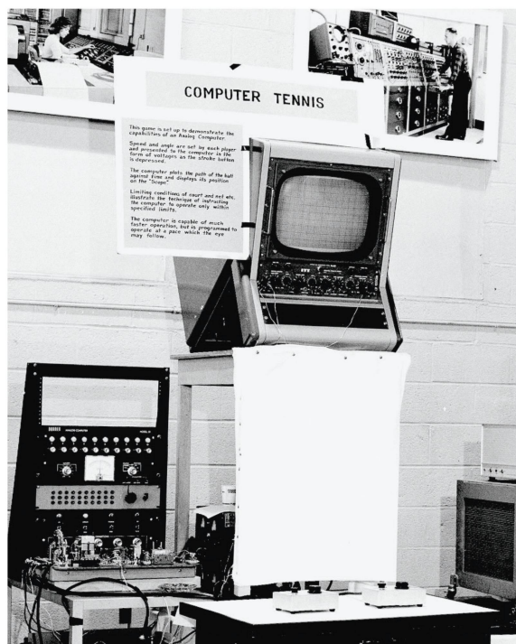
« Tennis for Two » était un des premiers jeux vidéo.

La transformation de l'industrie vidéoludique en poids lourd de l'économie mondiale est étroitement liée à l'essor technique de l'informatique. Ces deux secteurs font désormais partie de notre quotidien. En 2018, le chiffre d'affaires des jeux vidéo se montait à environ 138 milliards de dol-