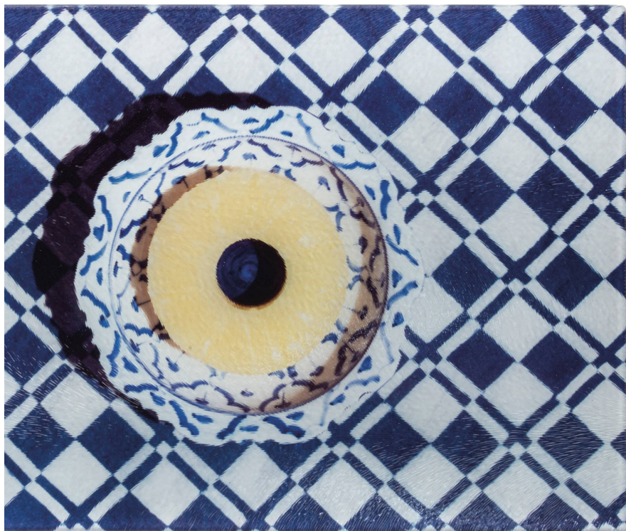
Planche à découper : Ananas Isabel Rotzler, verre, 28,5 x 20 cm / CHF 49

Capuchon : Beige 100 % mérinos, div. couleurs / CHF 125