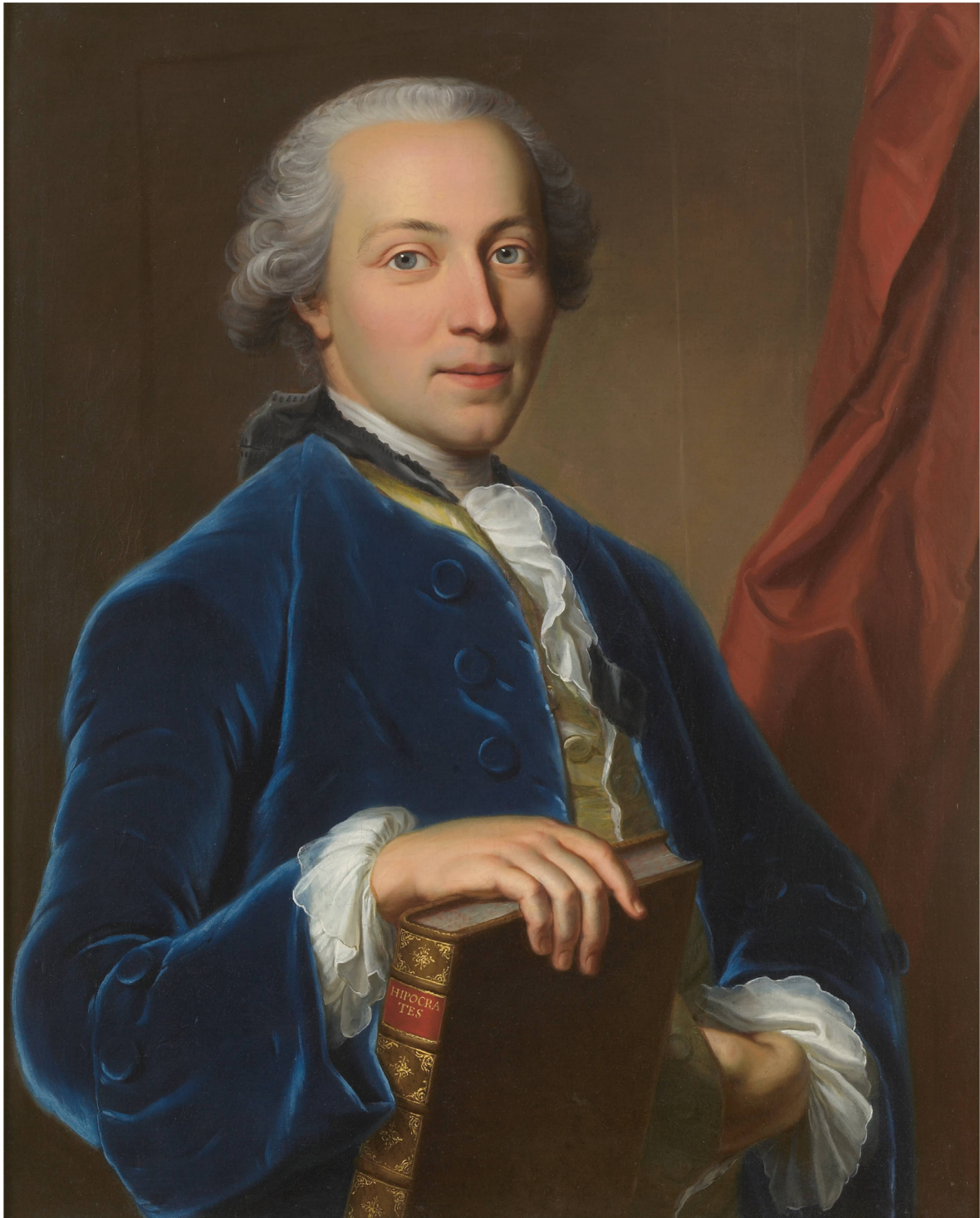
Portrait du médecin Samuel Auguste Tissot autour de 1770, peu après sa nomination de professeur de médecine honoris causa à l'Académie de Lausanne (par Emanuel Handmann).