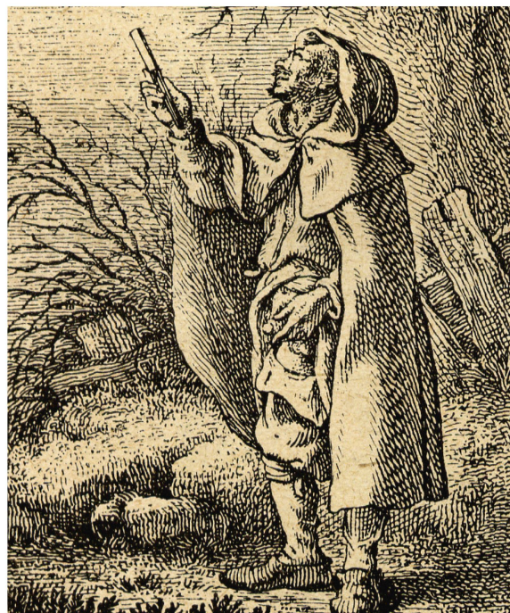
Gravure extraite du Taschenbuch für Aufklärer und Nichtaufklärer auf das Jahr 1791 (Collection Moll).

La publication du médecin donne naissance à un mouvement anti-masturbation d'ampleur mondiale