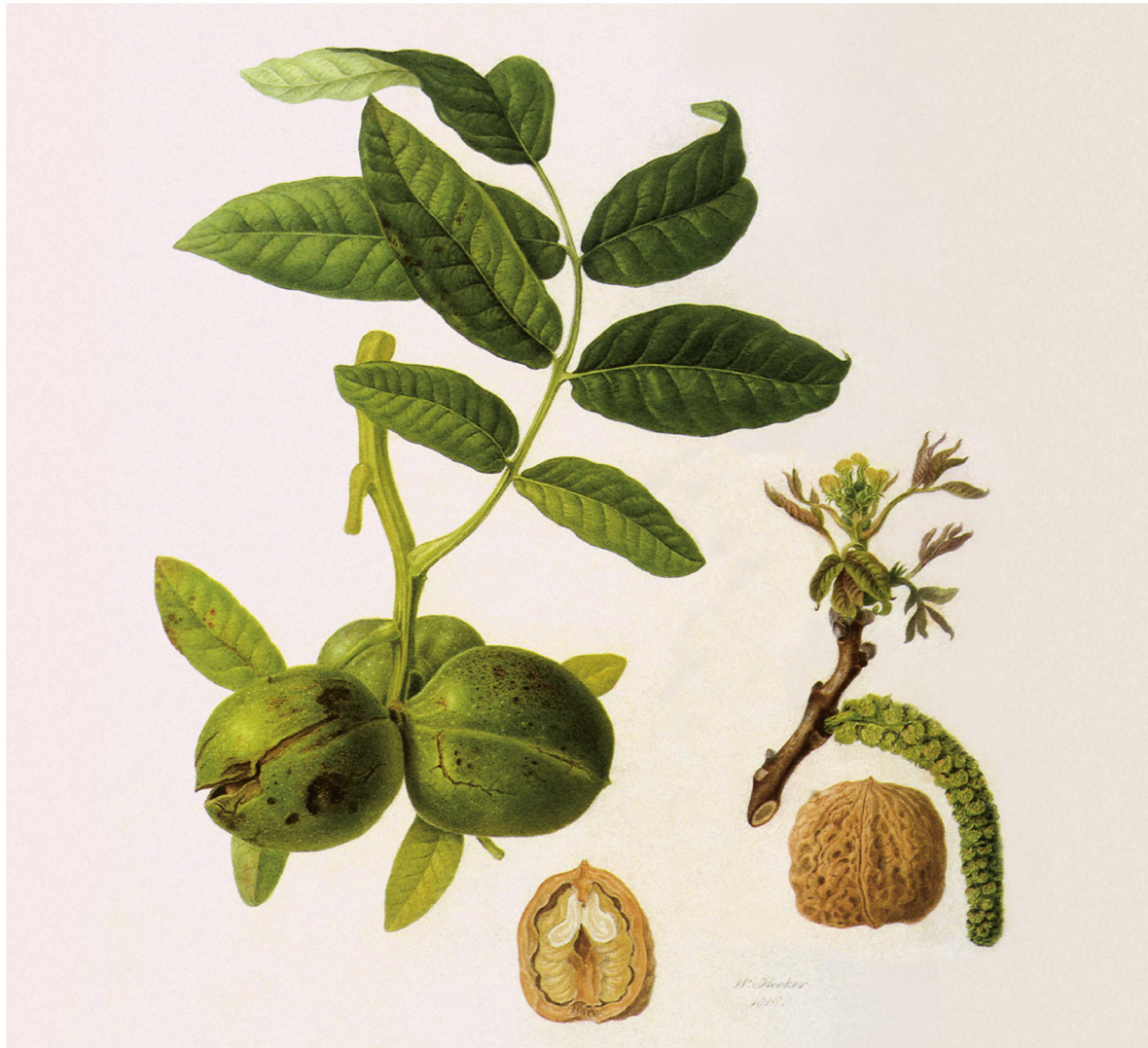
On disait que la noix était bénéfique pour le cerveau, puisque sa ressemblance est évidente.

« similia similibus curantur », qui signifie «les semblables soignent les semblables».