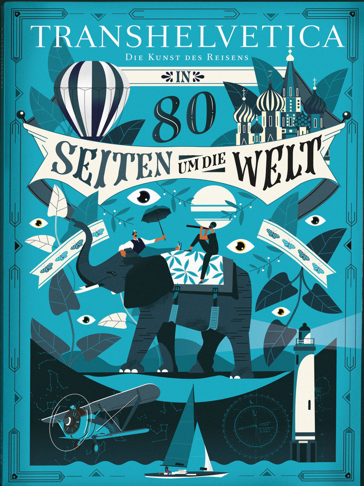
Illustration: Atelier cartographik, cartographik.com