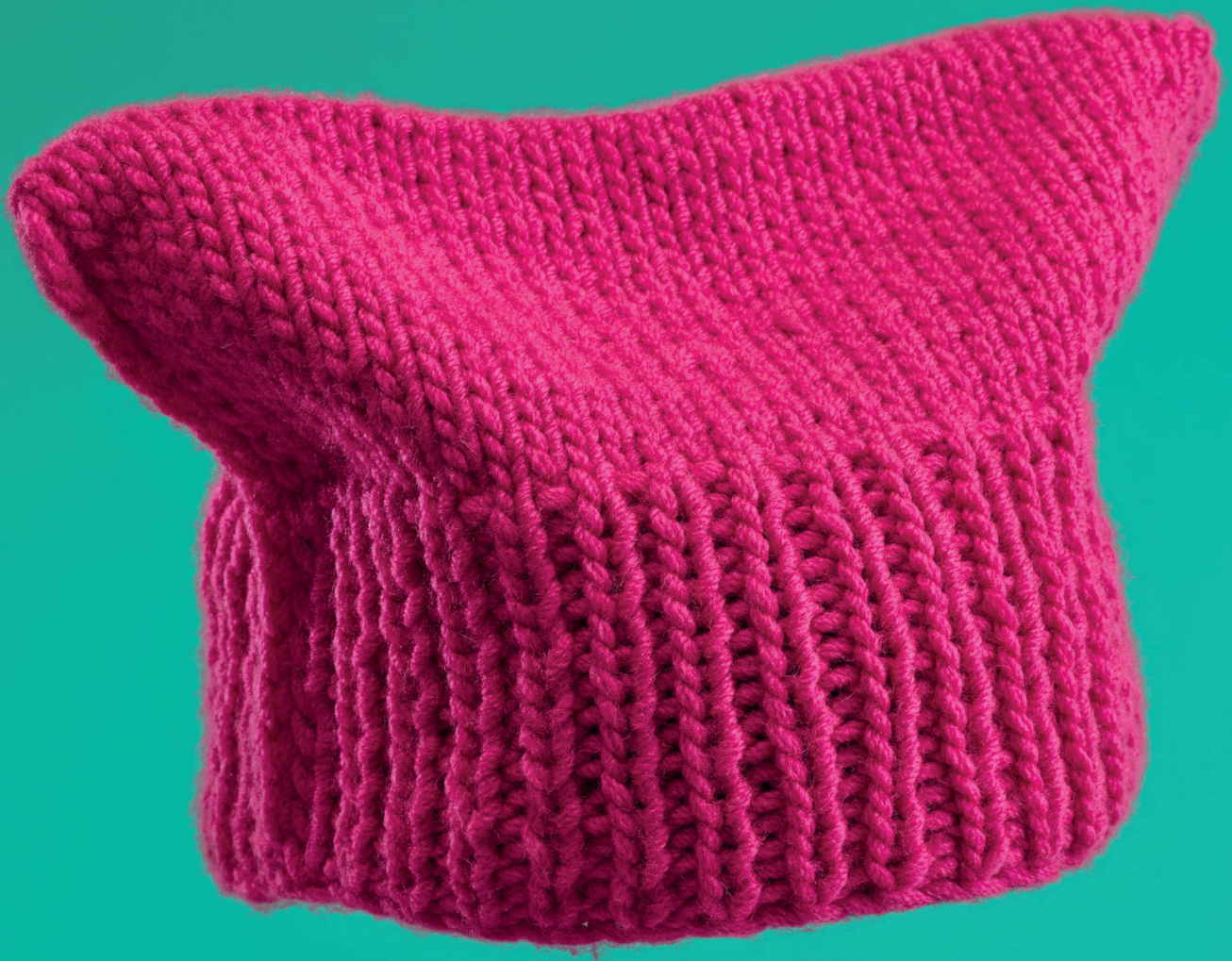
Le « pussy hat » de l'ancienne conseillère d'État et conseillère des États Eva Herzog. Ce bonnet tricoté rose fut le signe distinctif de la marche des femmes du 18 mars 2017 à Zurich.