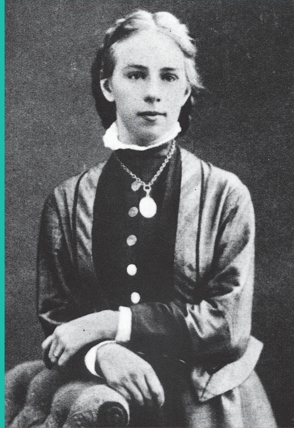
Emilie Kempin-Spyri, vers 1885.