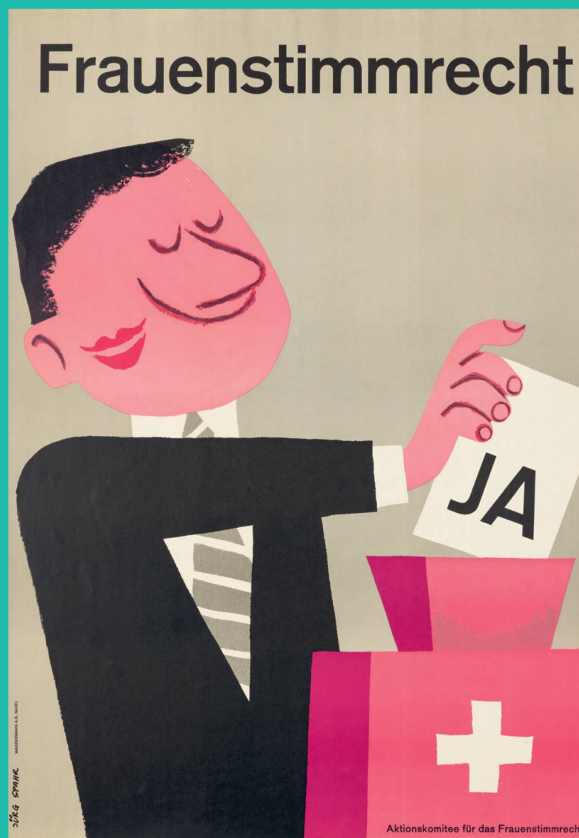
Affiche en faveur du suffrage féminin, 1959, Jürg Spahr

Dix ans plus tard, l'égalité en droit des hommes et des femmes est inscrite dans la Constitution. En 1996, la Suisse promulgue la loi fédérale sur l'égalité entre femmes et hommes, qui interdit toute discrimination, de quelque nature que ce soit, dans les rapports de travail. Si la cause féminine a fortement progressé au XX e siècle, le combat continue. Les inégalités salariales, le harcèlement sexuel ou le partage inégal des tâches domestiques, de l'éducation et de la garde des enfants sont des revendications qui restent d'actualité. ♀