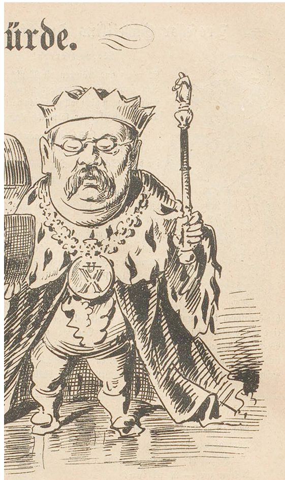
Le journal Nebelspalter a publié en 1880 des illustrations diffamatoires de Fridolin Anderwert.

lustrations diffamatoires. Des habitudes alimentaires du conseiller fédéral en surpoids aux rumeurs jamais avérées de fréquentation de maisons closes, tout fait l'objet d'articles de presse. L'Andelfinger Volksblatt et le journal bernois Tagwacht vont jusqu'à écrire le 25 décembre 1880: « Au nom de la vérité, il est de notre devoir d'affirmer que la fonction de président de la Confédération n'a jamais été occupée par un homme si moralement indigne qu'Anderwert. Son élection est une honte pour la Confédération tout entière. »