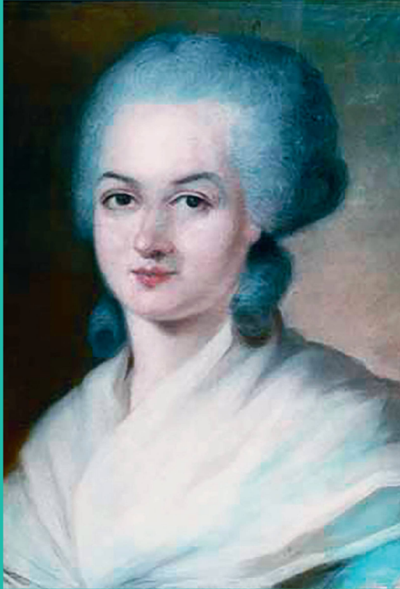
Olympe de Gouges, peinte par Alexandre Kucharski, XVIII e siècle.