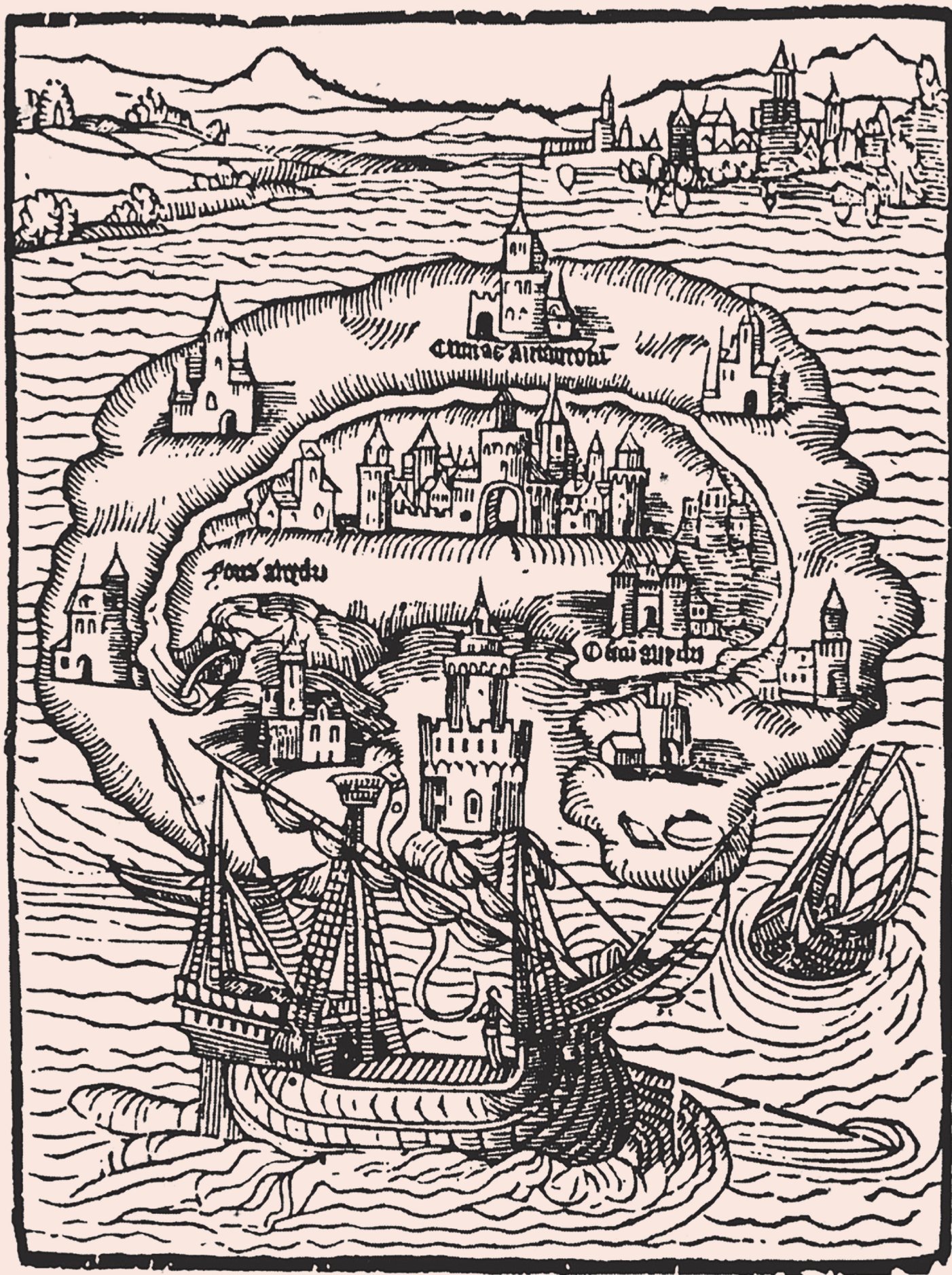
Gravure sur bois tirée de L'Utopie de Thomas More, 1516.