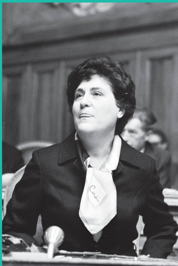
Emilie Lieberherr a été élue au Conseil des États en 1978.

La manifestation sert la cause des femmes et le suffrage féminin devient enfin une réalité en 1971.