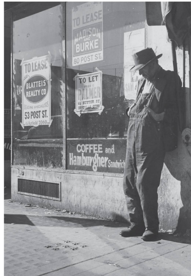
Chômeur lors de la Grande Dépression, image prise par Dorothea Lange, vers 1935.

Lorsque l'économie mondiale a basculé dans la grande crise