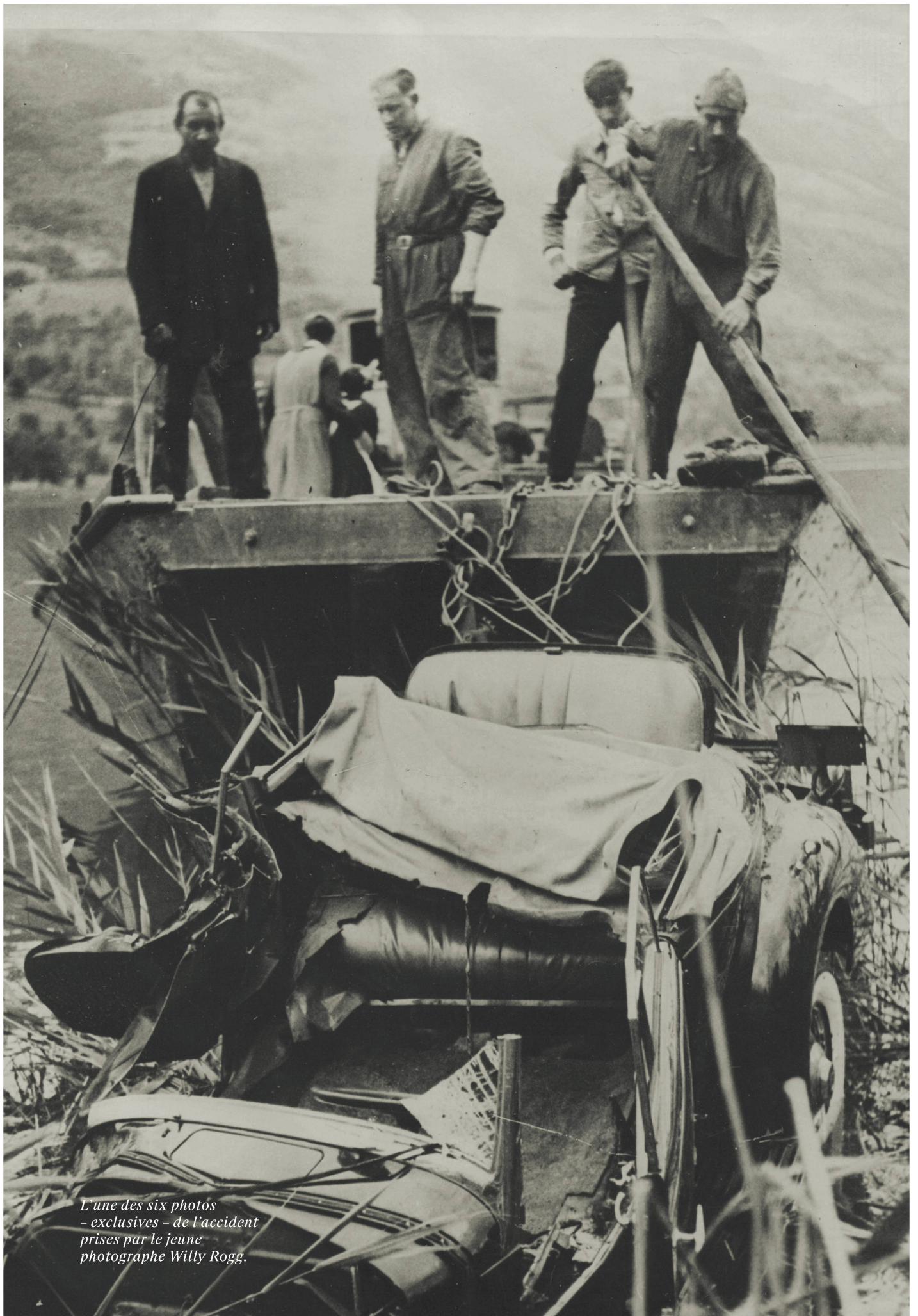
L'une des six photos - exclusives - de l'accident prises par le jeune photographe Willy Rogg.