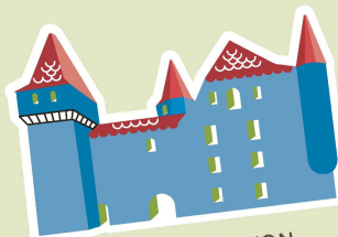
CHÂTEAU DE NYON