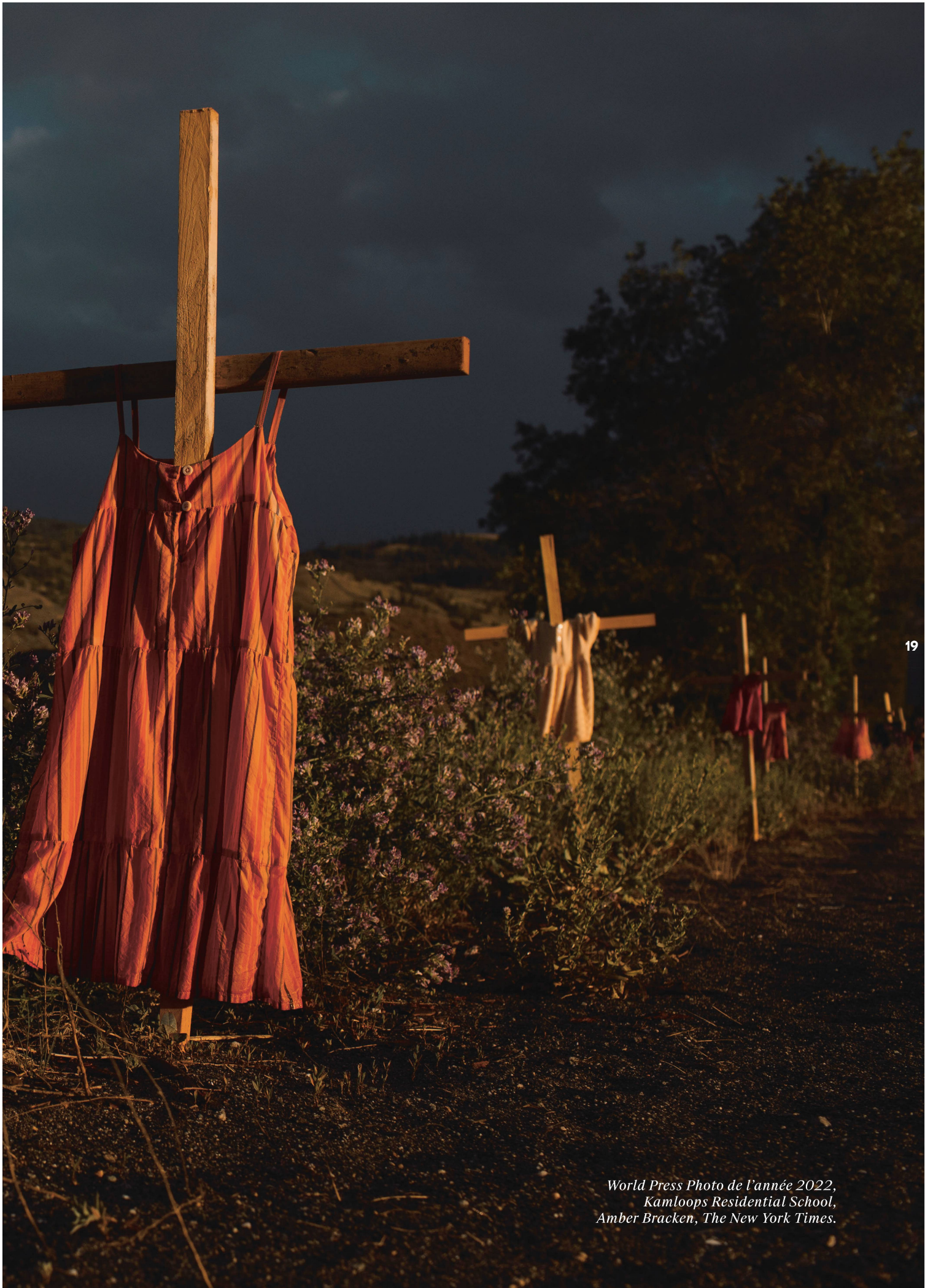
World Press Photo de l'année 2022, Kamloops Residential School, Amber Bracken, The New York Times.