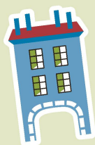
MUSÉE DU VIEUX COPPET