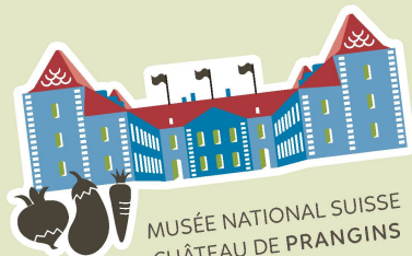
MUSÉE NATIONAL SUISSE CHÂTEAU DE PRANGINS