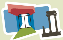
MUSÉE ROMAIN DE NYON