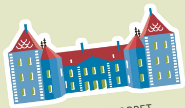
CHÂTEAU DE COPPET