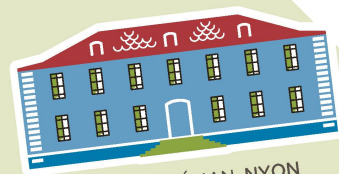
MUSÉE DU LÉMAN, NYON