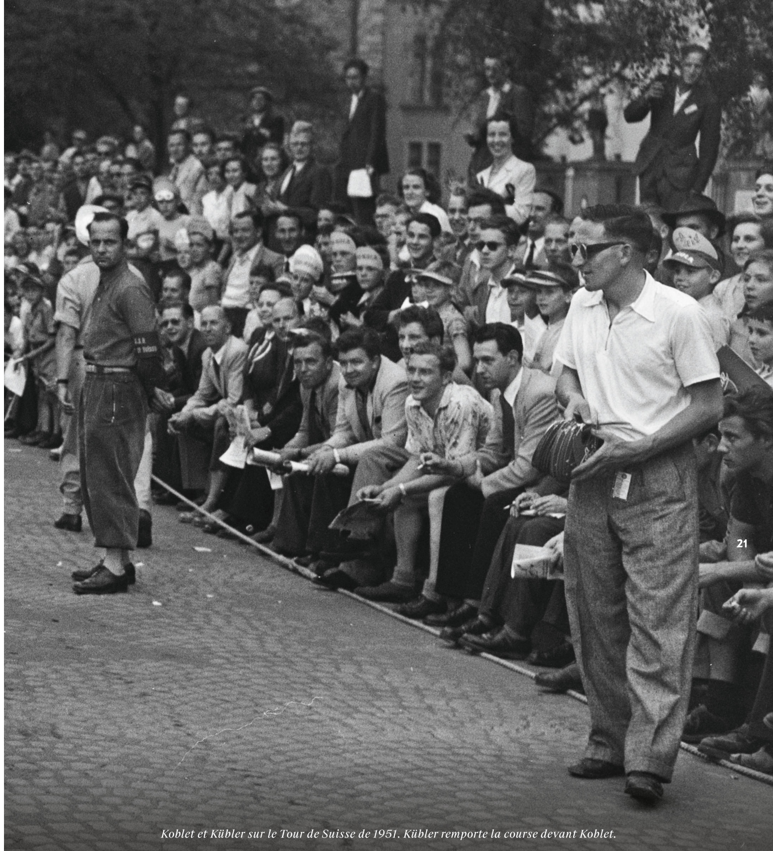
Koblet et Kübler sur le Tour de Suisse de 1951. Kübler remporte la course devant Koblet.

E n Suisse, le cyclisme passe quotidiennement par des hauts et des bas, au sens propre comme au figuré. L'histoire de la discipline fourmille d'ailleurs d'anecdotes.