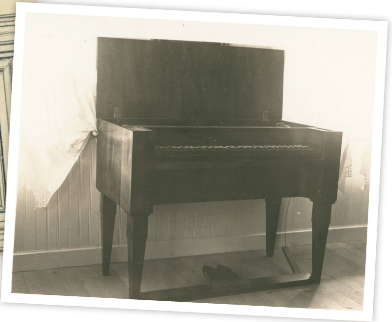
Certains objets n'ont pas été intégrés à la collection - il en reste cependant des traces.