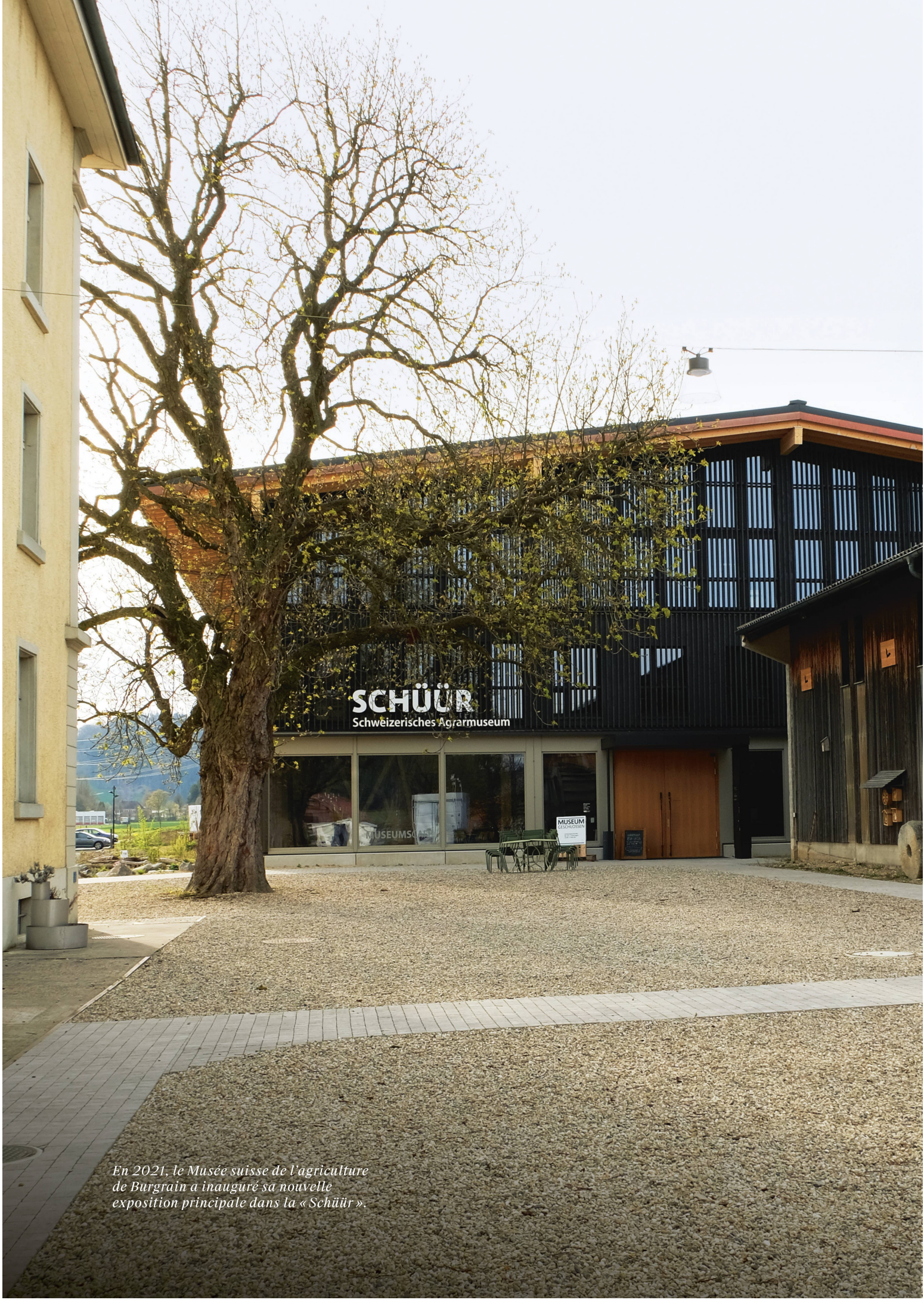
En 2021, le Musée suisse de l'agriculture de Burgrain a inauguré sa nouvelle exposition principale dans la « Schüür »