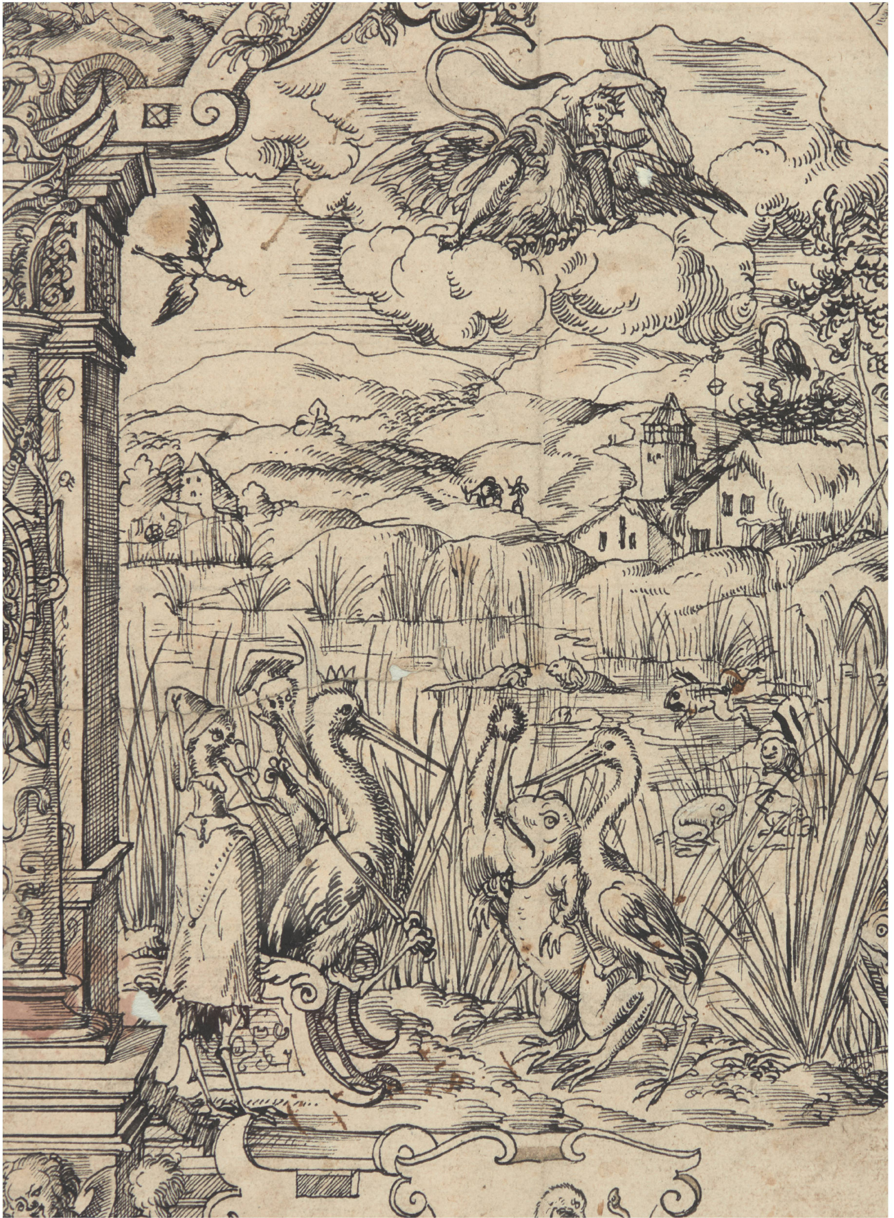
Carton d'un vitrail héraldique, vers 1570, attribué à Jost Amman : illustration de la fable d'Ésope, Les Grenouilles qui demandent un roi.