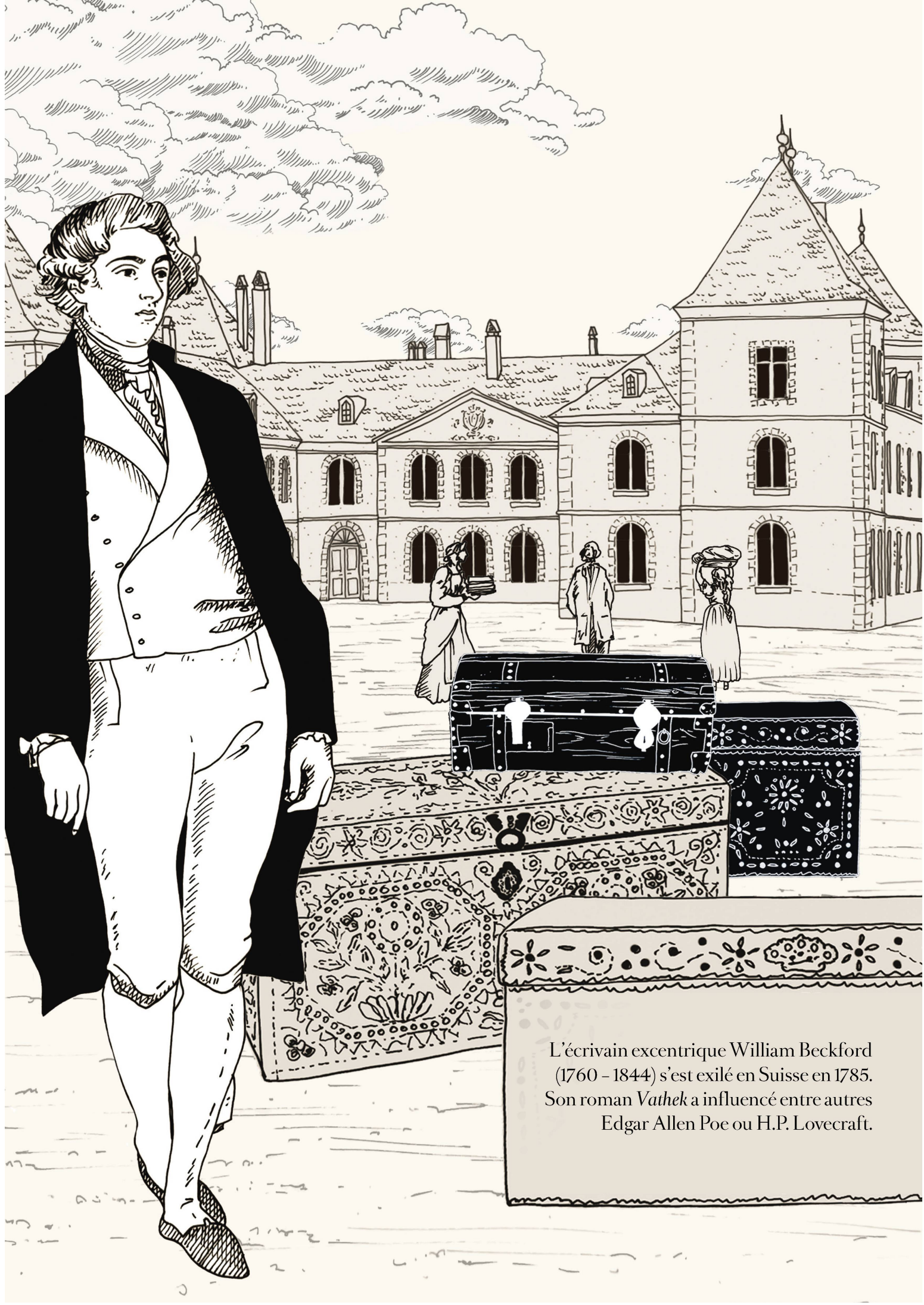
L'écrivain excentrique William Beckford (1760 - 1844) s'est exilé en Suisse en 1785. Son roman Vathek a influencé entre autres Edgar Allen Poe ou H.P. Lovecraft.