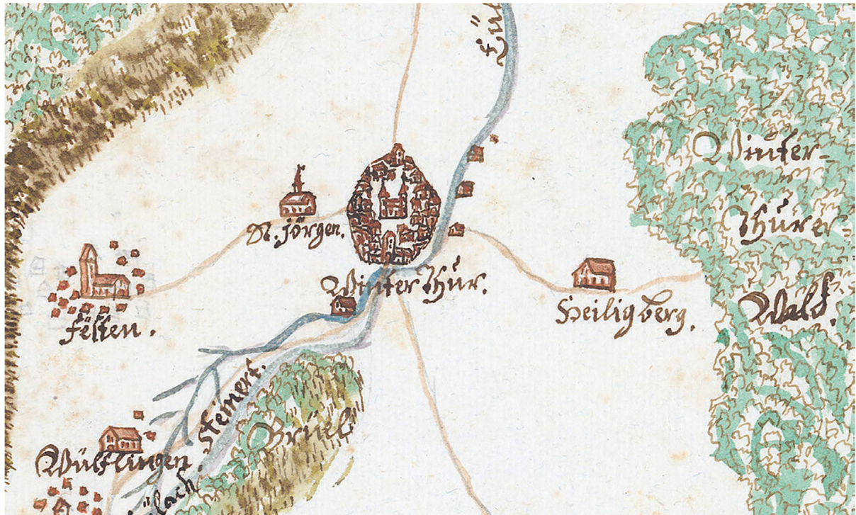
Carte de Winterthour et de ses environs, vers 1709.

tantes, en adaptant les noms à leur langue germanique. C'est ainsi que se sont formés, au fil des siècles, les toponymes suisses alémaniques que l'on connaît aujourd'hui. Ce changement de langue ne s'est bien sûr pas produit dans les régions romanes du pays, où les toponymes ont continué à se développer dans les langues et dialectes romans locaux.