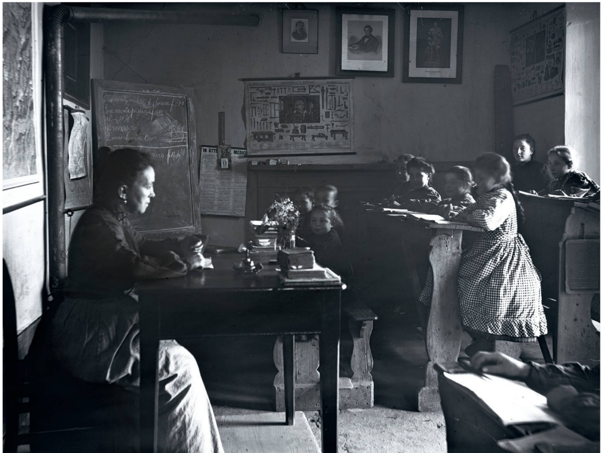
École de village tessinoise vers 1920. Photographe amateur Rudolf Zinggeler-Danioth, diapositive : Plaque sèche en gélatine sur verre.

gage local dominait au sein des foyers, c'est celui des lettrés et des fonctionnaires florentins qui s'imposait dans les livres et au sein du clergé. Cet italien gagna progressivement du terrain avec l'augmentation des échanges interrégionaux, si bien qu'au 19 e siècle, le dialecte fut écarté, voire banni des écoles. À la différence du patois en Suisse romande, les parlers lombards de Suisse italienne continuèrent cependant à être cultivés par de nombreuses familles au sein de leur foyer. Au 20 e siècle, le dialecte devint synonyme d'enracinement culturel. Il constitue aujourd'hui le langage de prédilection dans la sphère privée pour près d'un tiers de la population des régions italophones de Suisse. ●