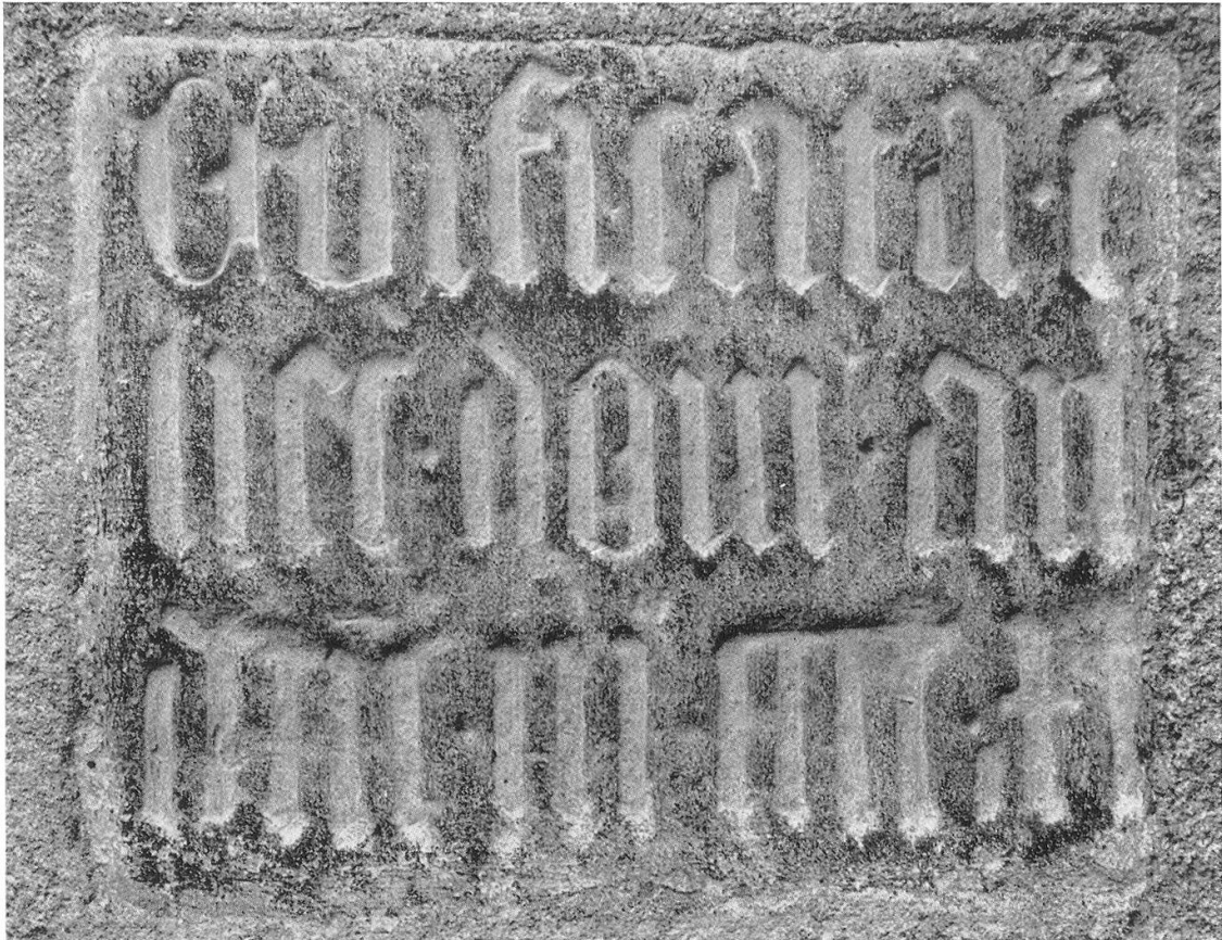
Bauinschrift in Niederweningen aus 1411