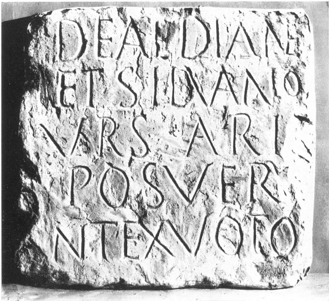
Römischer Votivstein in Zürich aus dem 3. Jahrhundert