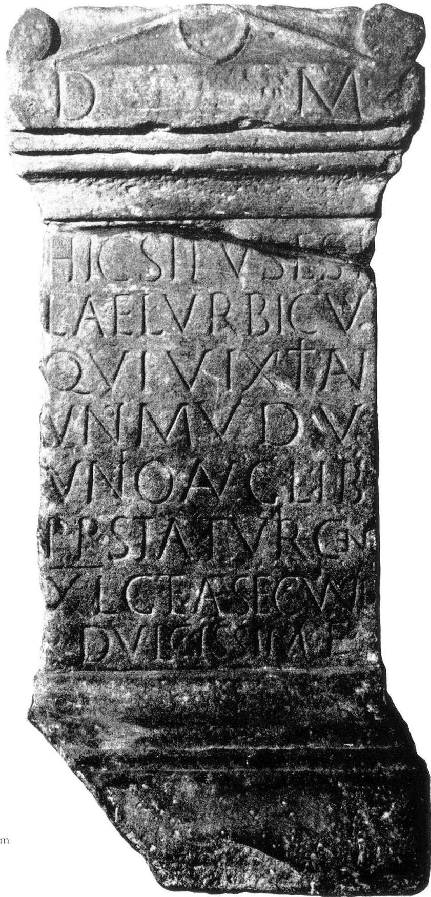
Römischer Grabstein in Zürich aus dem 2. Jahrhundert