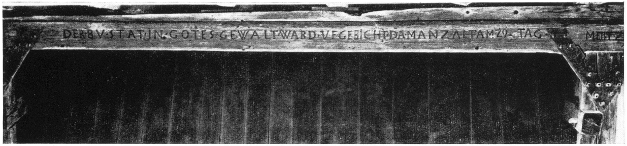
Dachbalken in Tagelswangen aus 1589