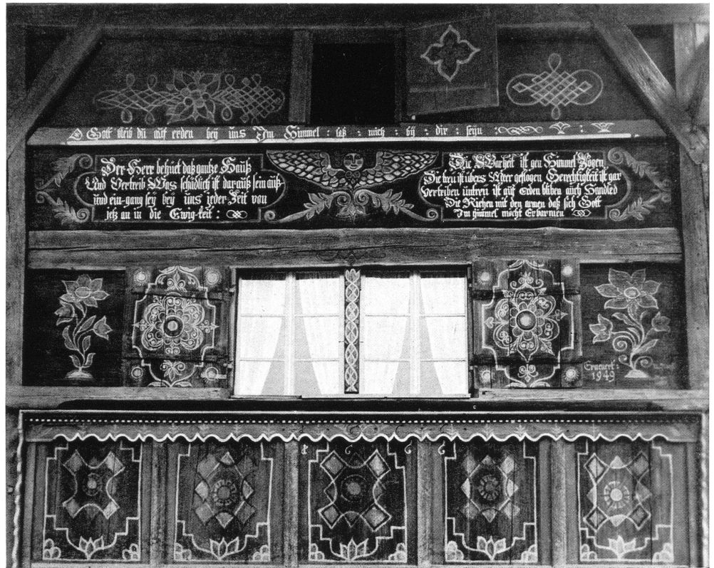
Wandmalerei in Wermatswil