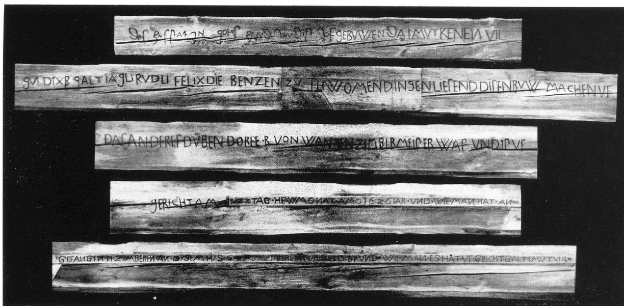
18 m langer Dachbalken in Schwamendingen aus 1626