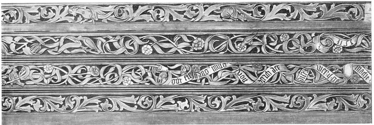
Spruchband in Maur aus 1511