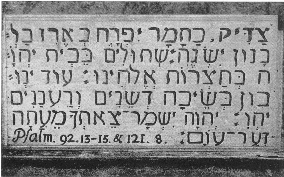
Hebräischer Spruch in der Balm, Hinwi