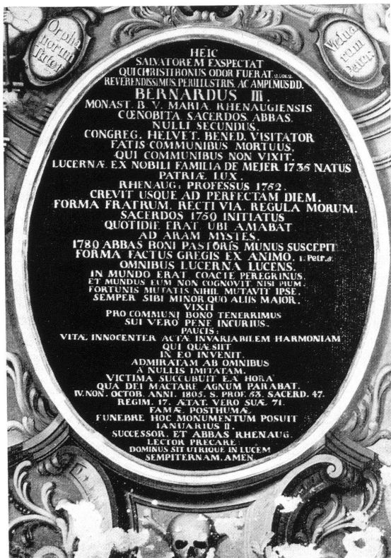
→ Epitaphium in Regensburg aus 1782