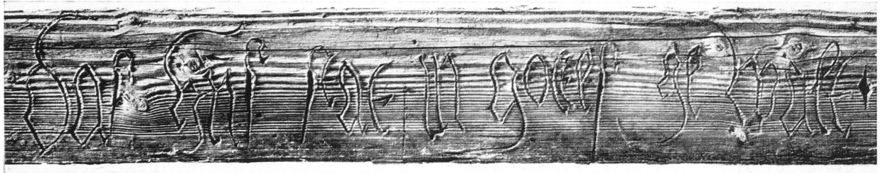
Teil eines Balkens in Pfäffikon aus 1599