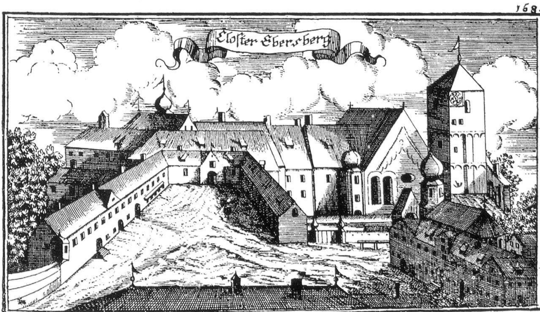
Kloster Ebersberg um 1700 Die Burg stand an der Stelle des Klosters