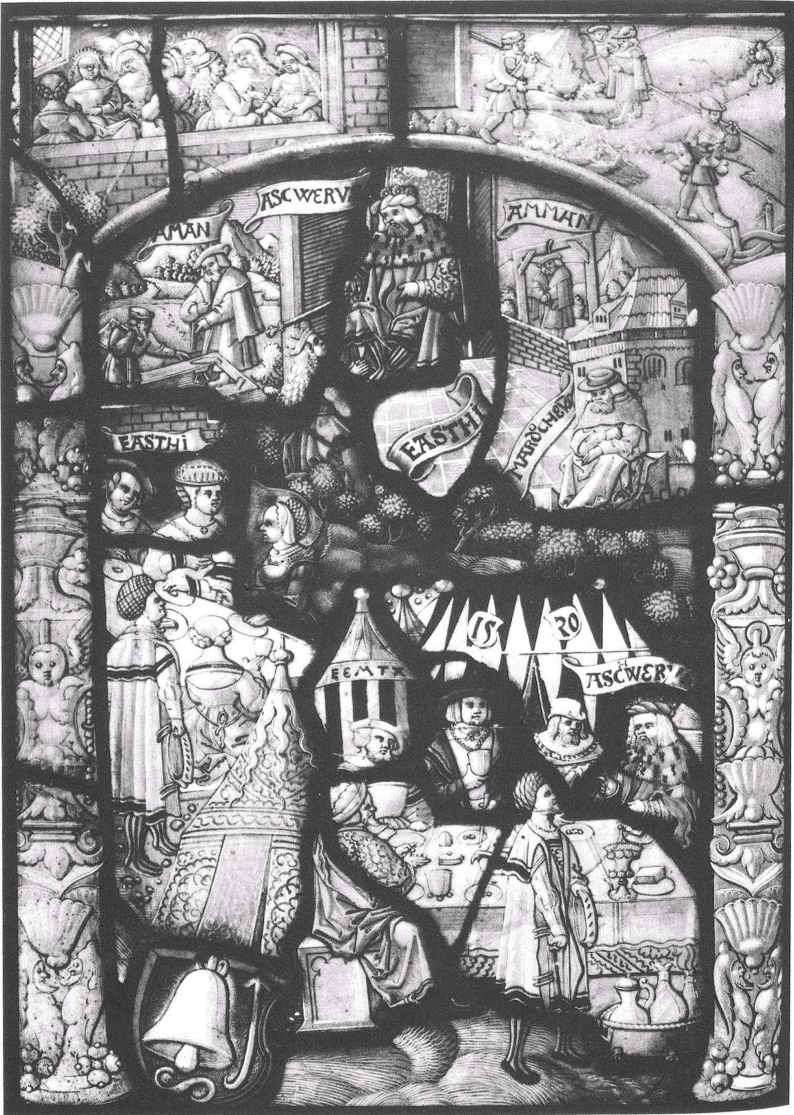
Kabinettscheibe mit Darstellung der Geschichte der Esther und Füessli-Wappen, 1520