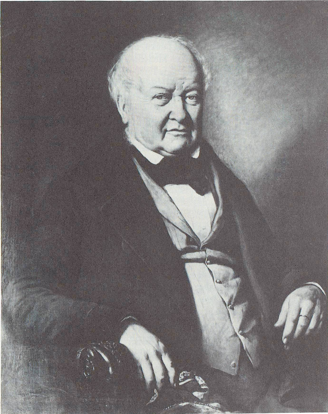
Heinrich Escher-Zollikofer (1776—1853), der Vater von Alfred Escher. Anonymes Ölgemälde, um 1840. (Nach einer Photographie in der Zentralbibliothek Zürich).