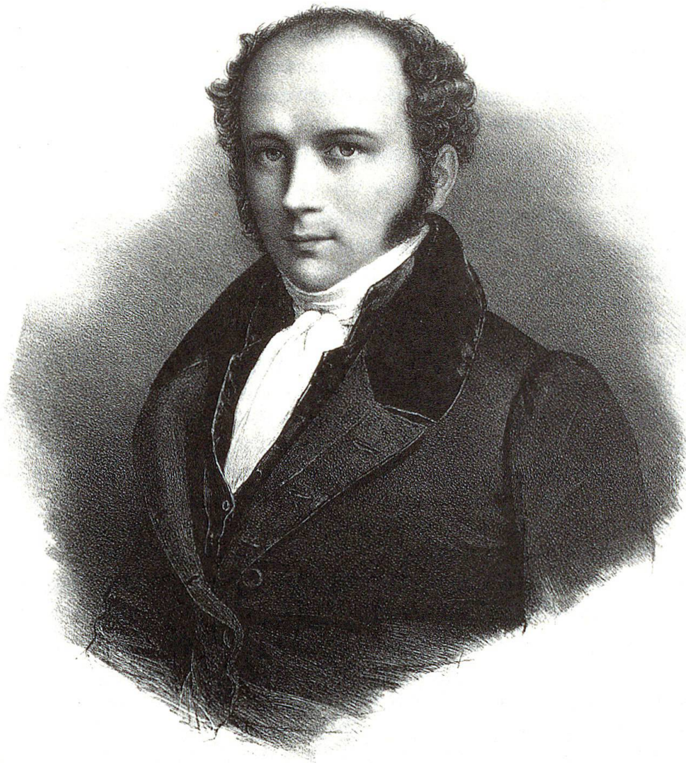
Gemalt von Bely