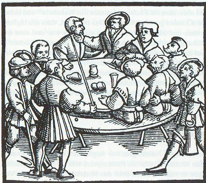
Abb. 59. Männer bei einem einfachen Mahl. Auf dem Tisch ist Brot und ein Messer zu sehen, ein Gehilfe bringt Wein.

Es ist unbestreitbar, dass die Fische auf dem Markt wie auch das Fangen und Essen von Fisch im Bewusstsein der mittelalterlichen Menschen durchaus gegenwärtig waren; direkte Rückschlüsse von den Bildquellen auf die Alltagswirklichkeit sind aber fragwürdig.