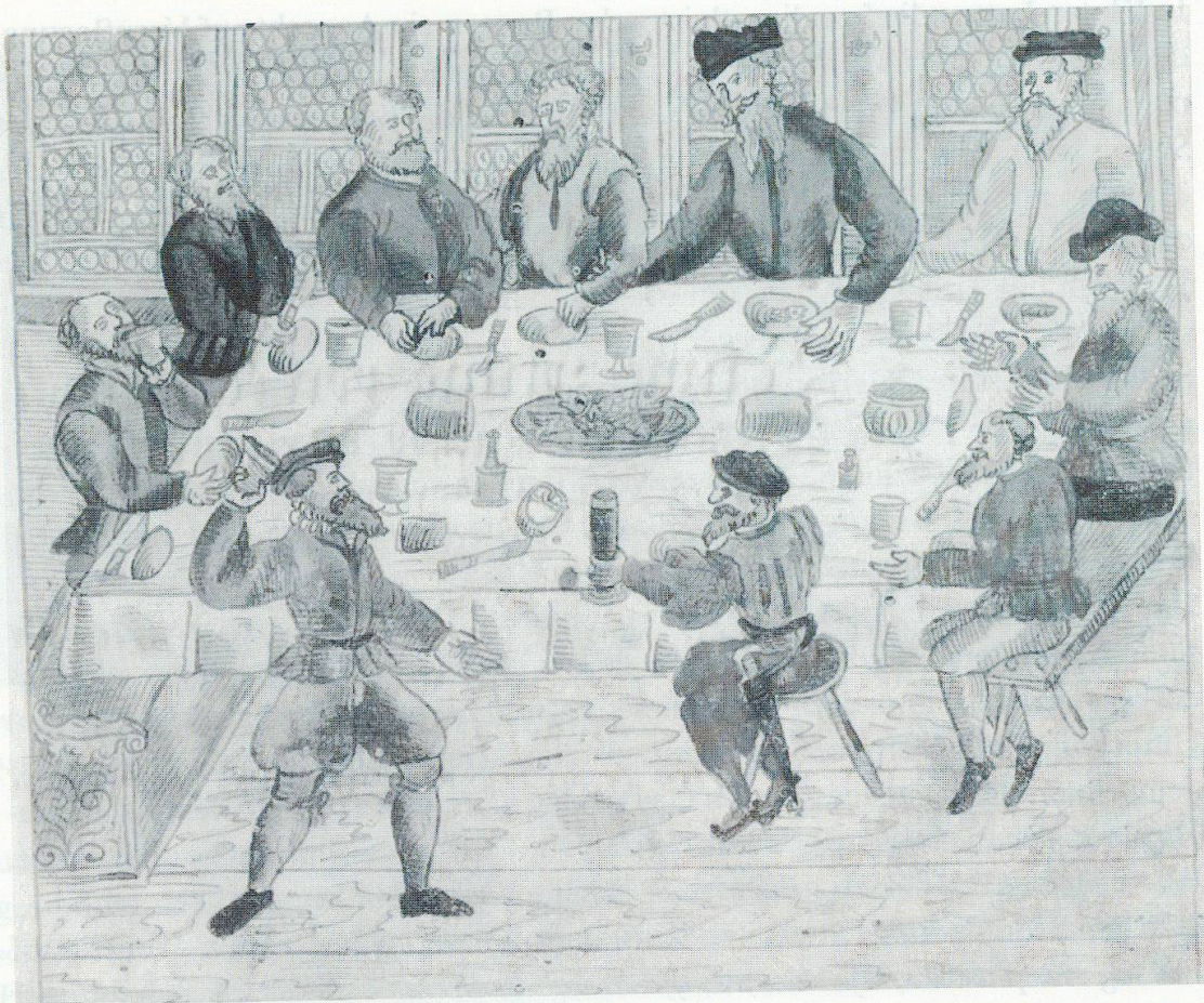
Abb. 61. So wie diese Runde leisteten sich die Trinkstubenbesucher gelegentlich ein Fischessen.