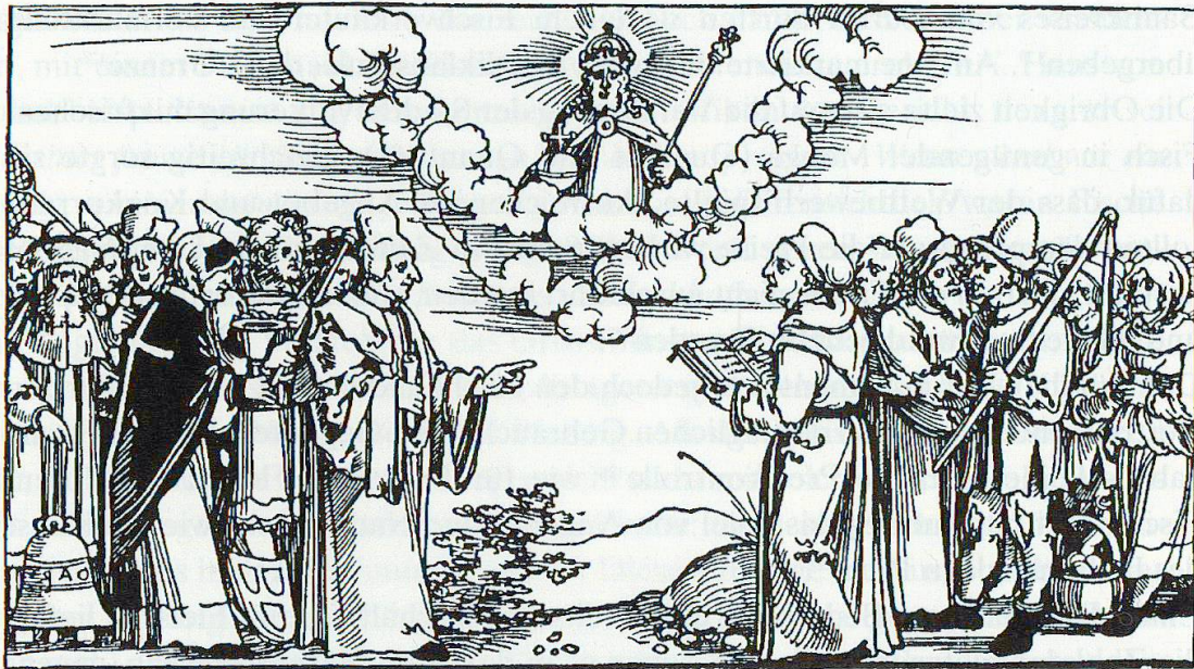
Abb. 62. Geistliche und Berufsleute, die angeblich wegen der Reformation ihren Broterwerb verloren haben, klagen Luther an. Mit dabei ist auch ein Fischer (hinten, erkennbar am Schöpfnetz).

Rats deutet darauf hin, dass die Leute (trotz der Aufhebung des Fastengebots) immer noch eifrig Fische konsumierten.