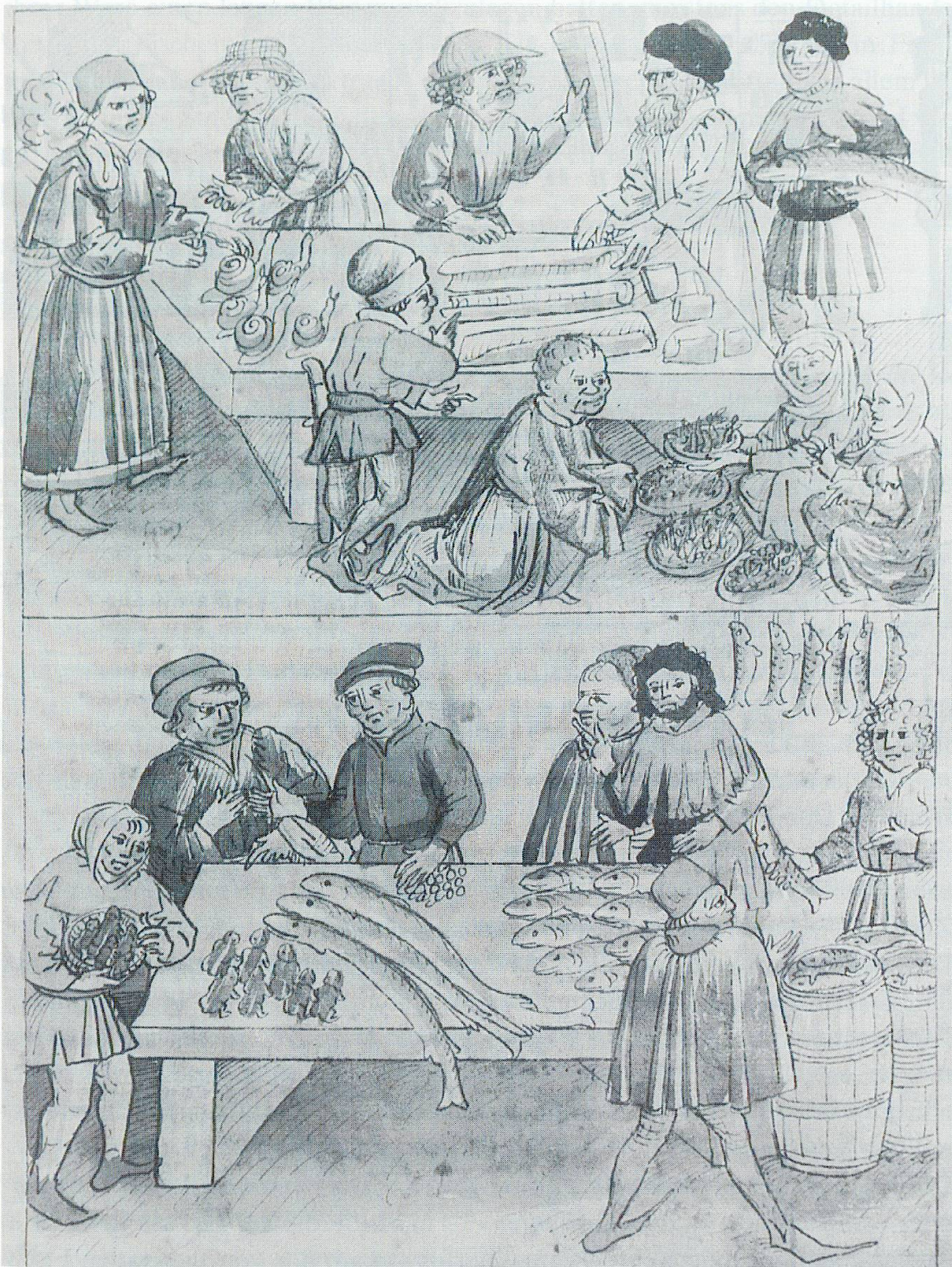
Abb. 63 (linke Seite) und 64. Reges Treiben auf dem Fischmarkt. Das Angebot war wohl nicht immer so üppig wie hier während des Konzils in Konstanz.