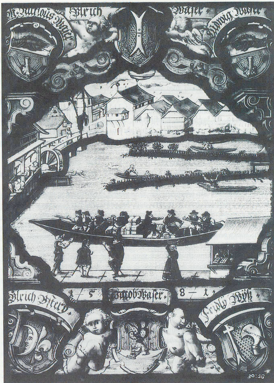
Abb. 72. Wappenscheibe der Zürcher Niederwasser-Schiffleute 1581.

Fischer 38 . 1425 erwarben die Schiffleute das Haus «zum Goldenen Engel» 39 ; die Oberwasserschiffer trafen sich in ihrer Trinkstube «zum Anker» 40 .