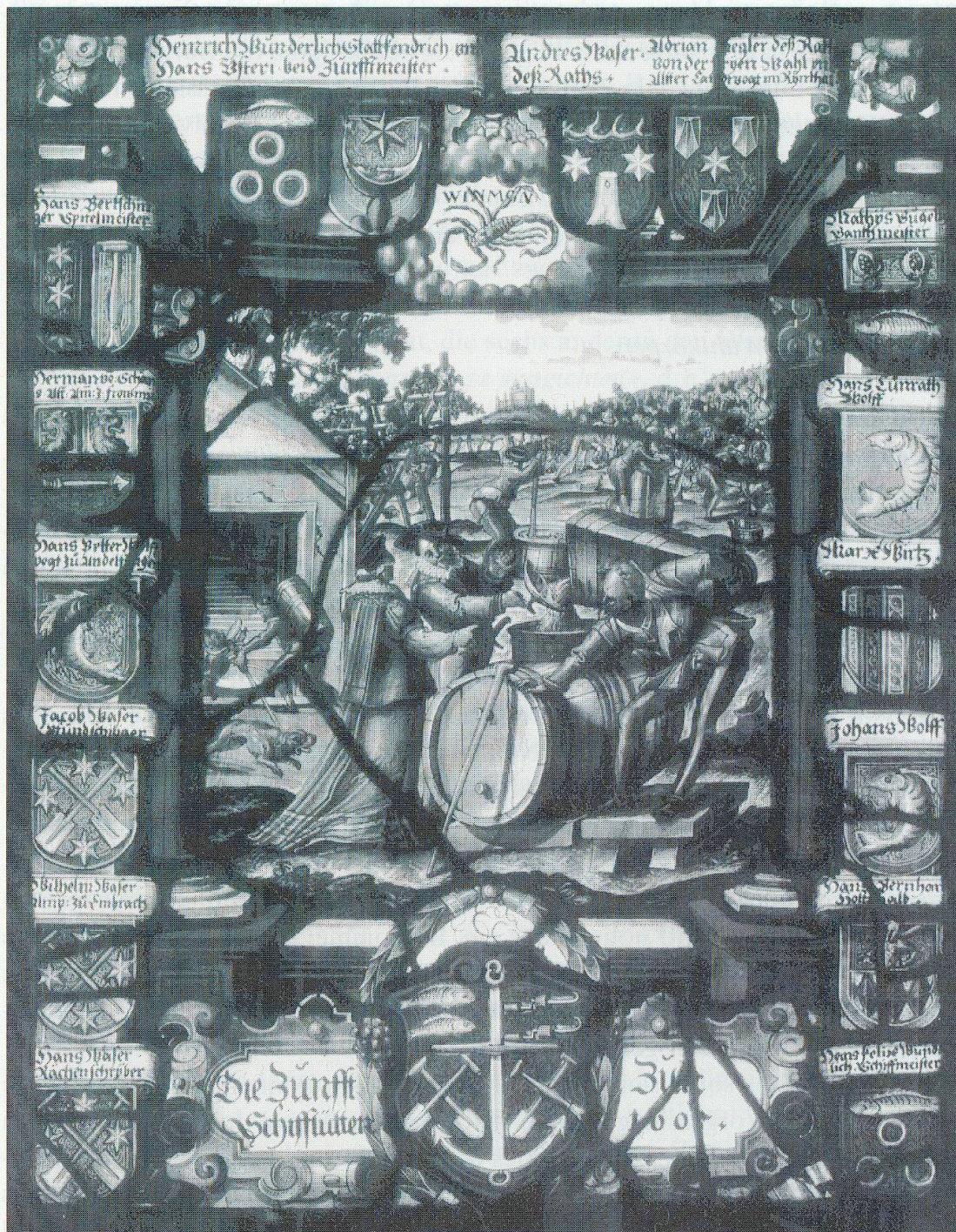
Abb. 73. Wappenscheibe der Zunft zur Schiffleuten 1605.