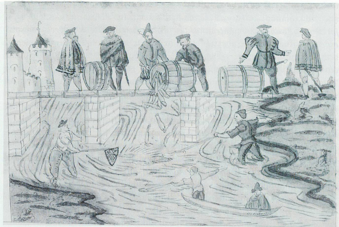
Abb. 75. Verdorbene Fische mussten die Fischverkäufer in den Fluss kippen.

achteten darauf, dass die Fische frisch waren. Sie mussten «zu allen morgen- und abend-merckten by geschworenen eyden harumb gan und all fisch, so uff den vischmerckt kompt, beschowen, und was deß marckts nit würdig ist, das angentz 193 heissen dannen thûn und usschütten und dannethin die selben fisch weder selbs behalten noch jemas 194 anderm, umbsunst oder umb gelt, geben» 195 . Kein Fisch durfte auf dem Markt zerteilt werden, bevor er nicht durch die Beschauer besichtigt und für frisch befunden worden war 196 .