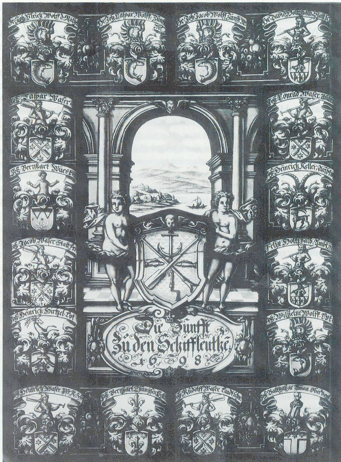
Abb. 74. Wappenscheibe der Zunft zur Schiffleuten 1698.