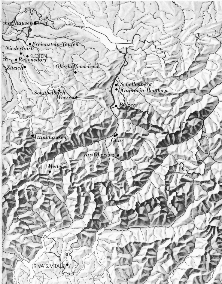
Avenches: Römische und mittelalterliche Objekte Attinghausen: Mittelalterliche Objekte