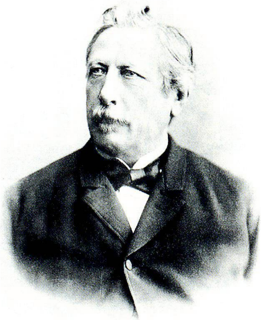
Bundesrat Karl Schenk. Bild aus der «Festgabe auf die Eröffnung des Schweizerischen Landesmuseums in Zürich».