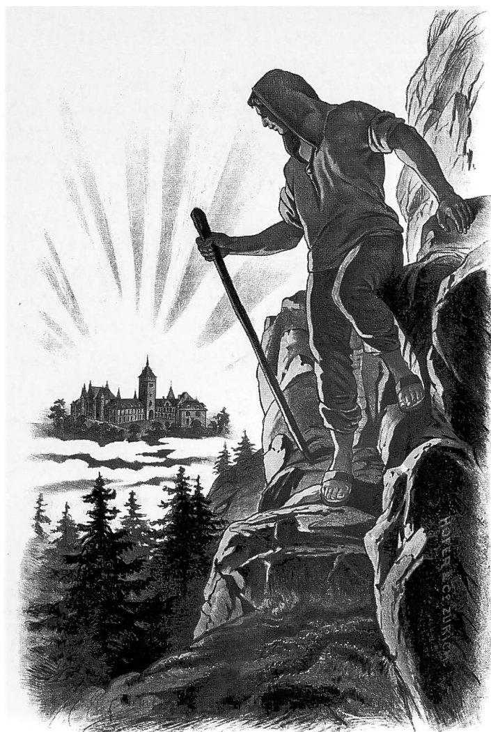
Abb. 5. Plakat zur feierlichen Eröffnung des Schweizerischen Landesmuseums am 25. Juni 1898 in Zürich.

wissenschaftliches Prestige in der Schweiz. Und überdies sollten diese Sammlungen noch einen ungewöhnlich starken Einfluss auf die Museographie der neuen Einrichtung ausüben. 28 Auch hier hat also die Antiquarische Gesellschaft ihren Stempel aufgedrückt.