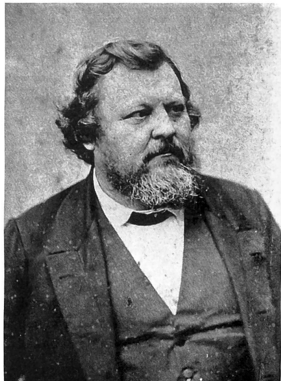
Abb. 2. Oben: Adolphe Morlot (1820–1867); Gabriel de Mortillet (1821–1898); unten: Edouard Desor (1811–1882); Carl Vogt (1817–1895).