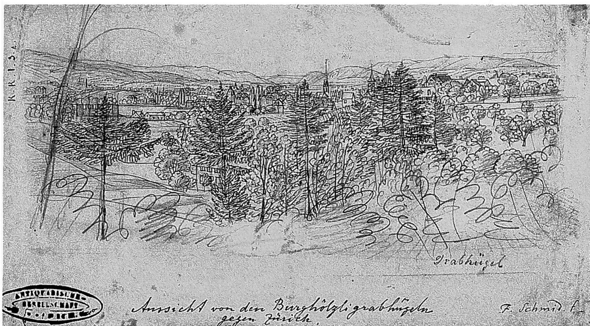
Abb. 1. Aussicht von den Burghölzli-Grabhügeln gegen Zürich, wohl 1832. Gezeichnet von F. Schmid. (Zeichnungsbücher AGZ, «Keltisch-Römisch-Fränkisch», Bd. I)

Die Gründung der Antiquarischen Gesellschaft in Zürich beruhte auf einem Zufall, wenn man den Festschriften folgen will, die deren Geschichte durchziehen. 2 Eines schönen Abends im Frühling 1832 macht Ferdinand Keller im Burghölzli (Abb. 1) vor den Toren Zürichs einen Spaziergang und trifft dabei auf einige Arbeiter, die bei Rodungsarbeiten auf einen Grabhügel gestossen waren und gerade damit beschäftigt sind Gräber mit ungewöhnlichen Beigaben zu Tage fördern. Keller erkennt sogleich das hohe Alter dieser Funde und damit ihre Bedeutung. Den begeisterten Naturforscher und Historiker drängt es, diese ferne, dunkle Vergangenheit zu erkunden. Ein starkes Verlangen, dieses lang vernachlässigte kulturelle Erbe zu bewahren, lässt ihn nicht mehr los und er macht sich daran, in seinem Bekanntenkreis Unterstützung für diese Sache zu gewinnen. An der Spitze eines sechsköpfigen Komitees gründet er die Antiquarische Gesellschaft in Zürich, die erste gelehrte Gesellschaft der Schweiz, die sich ausschliesslich mit Altertümern beschäftigte.