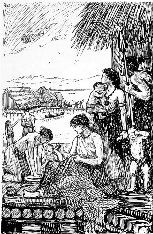
Abb. 2. Die Pfahlbauer. Zeichnung von Dora Hauth im Zürcher Lesebuch für das 5. Schuljahr (1927). Ankers Pfahlbauerin wird zitiert in beiden Frauengestalten, in der nach links in die Ferne blickenden Mutter mit Kind und in der sitzenden Frau, die hier weibliche Arbeit verrichtet.

weniger als Jagd und Fischfang. (...) Der Fischende lehnte an das Geländer, das rings um den Pfahlbau lief, oder fuhr in einem ausgehöhlten Baumstamm, dem Einbaum, über den See. Das Wasser wimmelte von Fischen, die mit der Angel oder dem Netze gefangen oder mit der Harpune aufgespießt wurden.» 11