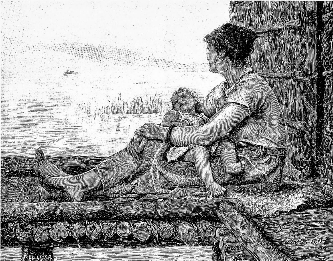
Abb. 1. Pfahlbauerin. Nach dem Gemälde von Albert Anker. Illustration im Zürcher Lesebuch für das 5. Schuljahr (1906).

Die Faszination, die vom Modell ausging und in tieferen psychologischen Schichten gründet, spricht auch aus Albert Ankers Bild der Pfahlbauerin , das Adolf Lüthi in sein Lesebuch für die Zürcher Fünftklässler (Abb. 1) übernommen hat. 8 Christin Osterwalder sagt dazu: «Das Gemälde entspricht mit seiner Kombination von Geborgenheit, urtümlicher Romantik und doch behaglicher Reinlichkeit ganz offensichtlich einem heimlichen Sehnen des modernen Zivilisationsbürgers.» 9