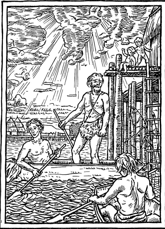
Abb. 4. Pfahlbauer im Frühlicht. Zeichnung von August Aeppli zu Meinrad Lienerts Erzählungen aus der Schweizer-Geschichte . Ein weit überhöhter Pfahlrost, athletische Männer neben puttenähnlichen Kindern vor barockem Gewölk: Symbole für einen heroischen Auftakt unserer eigenen Geschichte.

wagten sie sich ans Ufer und in die dichten, ungeheuren Wälder, die fast überall Berg und Tal bedeckten. Dort jagten sie denn auch unermüdlich die vielen wilden Tiere, von denen der Hochwald und das Unterholz voll waren, und die Buben und Mägdlein gingen nach allerlei Beeren und nach Haselnüssen auch etwa ein Stück weit in die Wildnis hinein.» 15