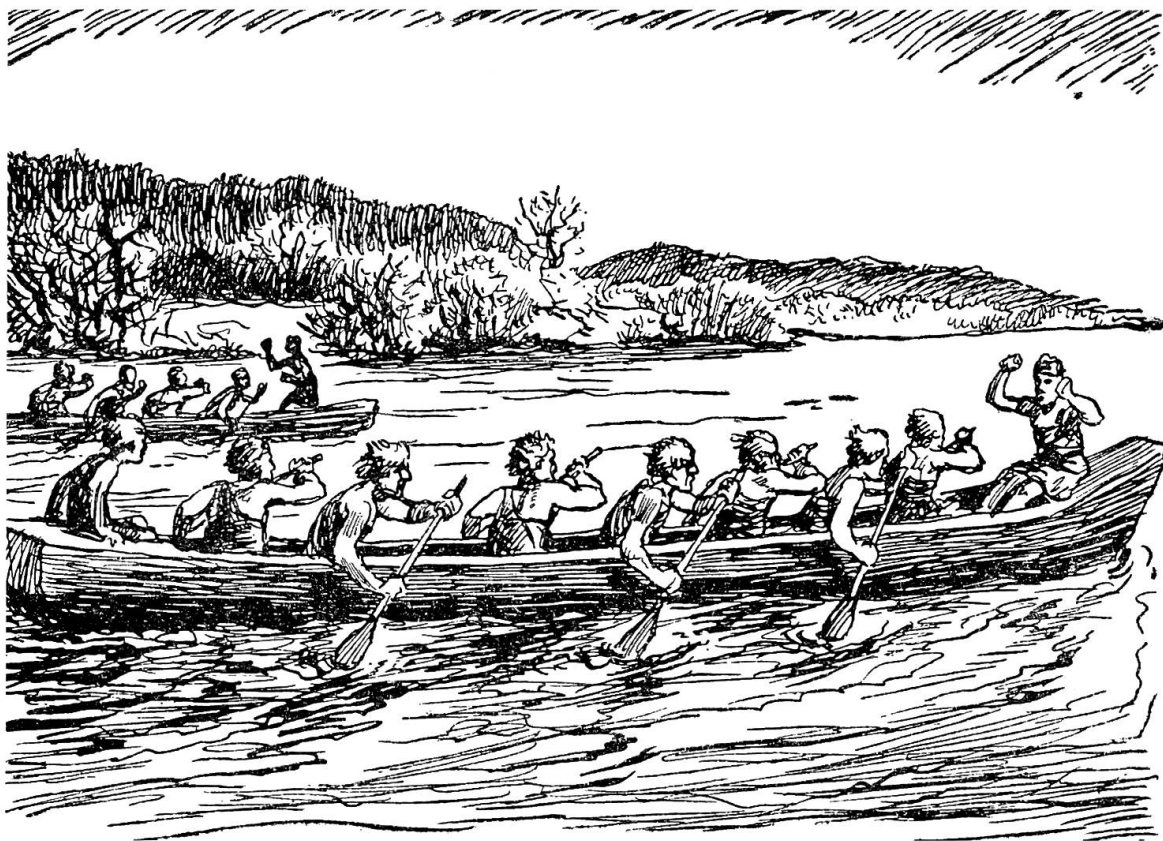
Abb. 5. Wettrudern der Einbäume. Illustration von Werner Chomton in Karl Keller-Tarnuzzers Die Inselleute vom Bodensee .