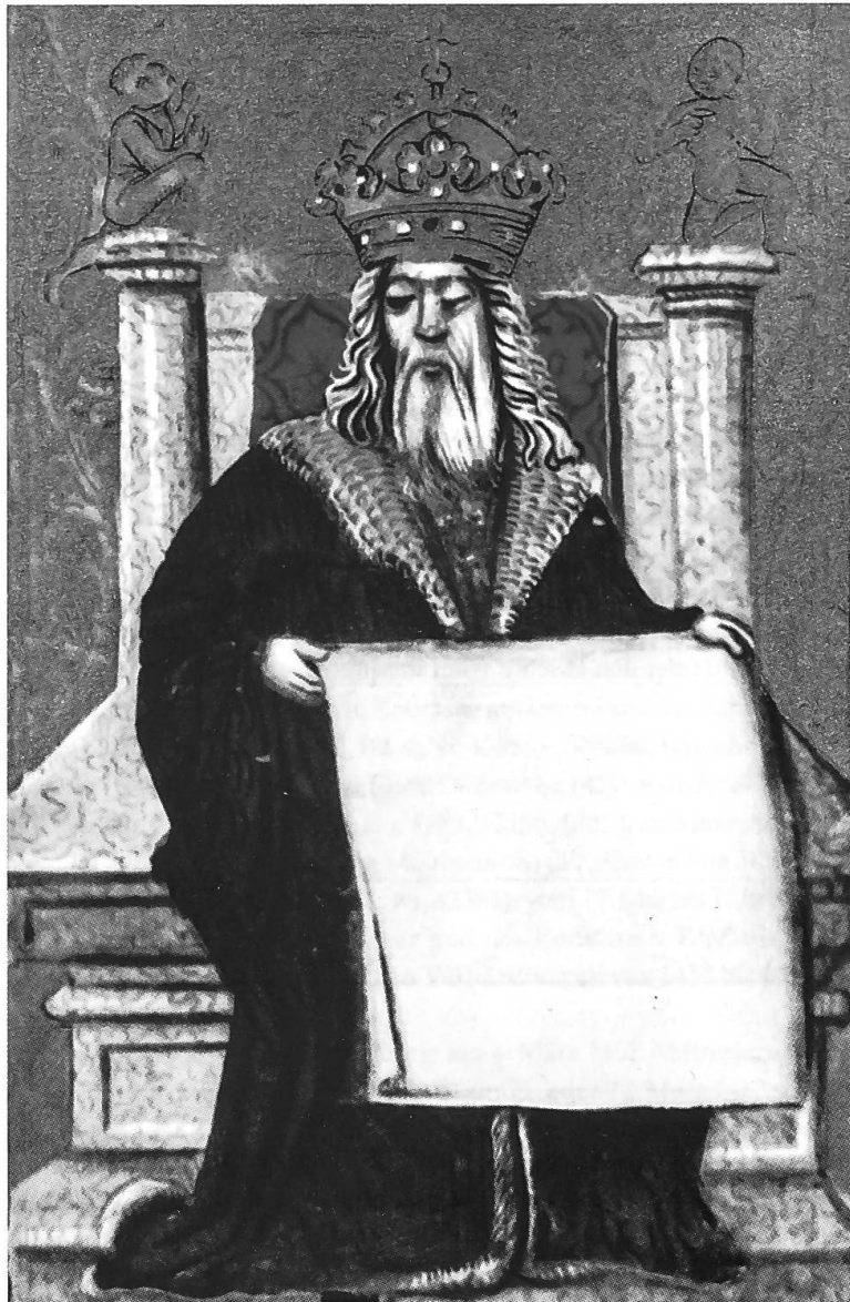
Abb. 34: Albrecht VI. als Herrscher und Gründer der Universität Freiburg; Darstellung im Statutenbuch des Collegium Sapientiae des Johannes Kerer, das um 1500 in Augsburg angefertigt wurde. Es orientiert sich an einer Darstellung Albrechts in seinem Gebetbuch, das noch zu seinen Lebzeiten angefertigt wurde. (Universitätsarchiv Freiburg im Breisgau A 105 / 8141, fol. 2 v)