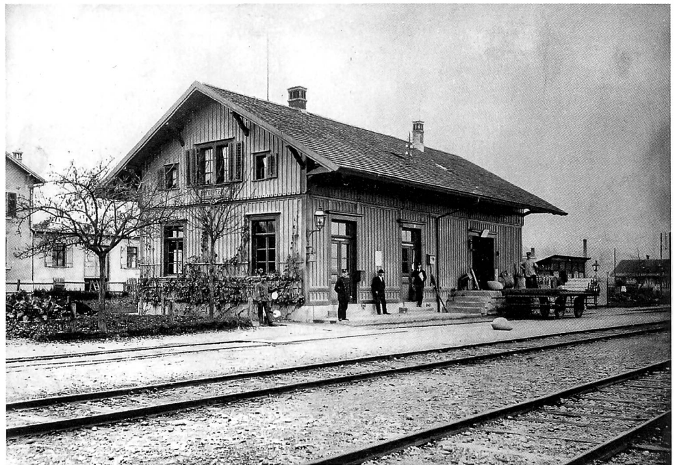
Der Bahnhof Dinhard im heutigen Zustand. Den Urzustand von vor 1880 gibt eine Ansicht von Zürich-Affoltern am besten wieder.