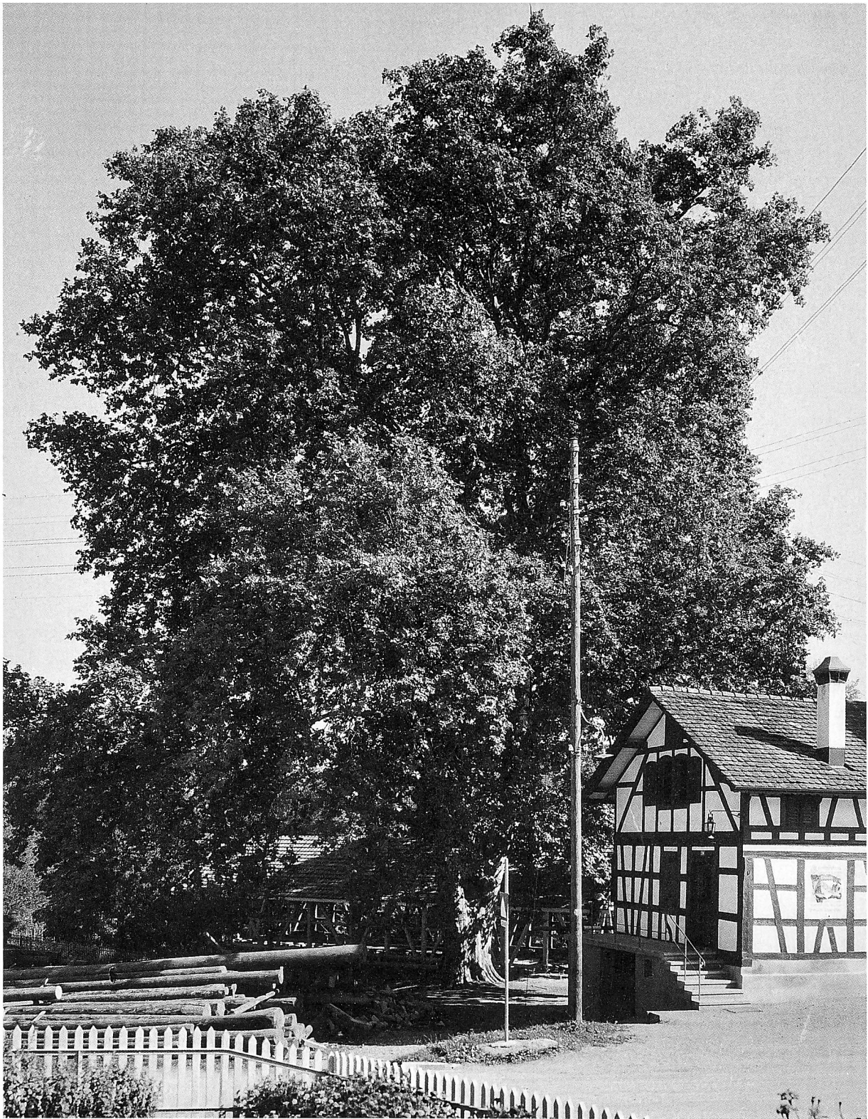
Die mächtige Platane von Ellikon, die 1798 als Freiheitsbaum gepflanzt worden war und zusammen mit dem Gemeindehaus und der Mühle ein idyllisches Ensemble bildet.