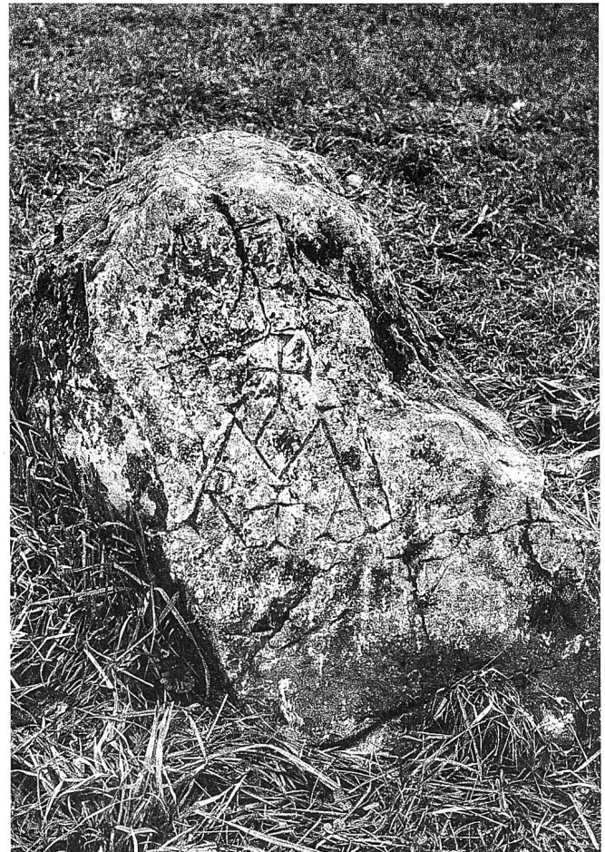
Marchstein an der Zehntengrenze von Hedingen mit dem vorreformatorischen Mariogramm.